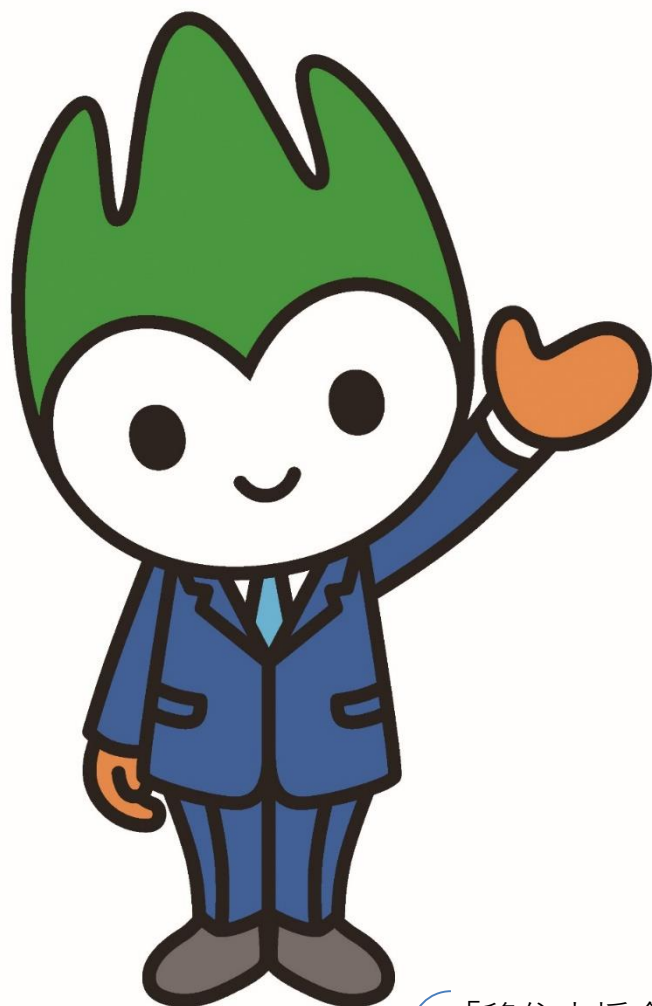
山口県PR本部長 ちよるる