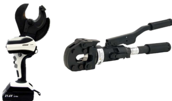
(左) 電気装置を備えたケーブルカッター