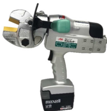
電気装置及び油圧装置を備えたボルトクリッパー