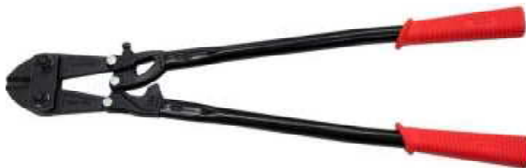
手動両手式のボルトクリッパー

なお、ボルトクリッパーという商品名で販売されていなかったとしても、鉄筋等の鋼材を切断するための工具として設計、製造又は販売されているものについては、ボルトクリッパーに該当する。