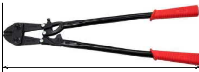
ボルトクリッパーの「長さ」

なお、ラチェット機構を備えているボルトクリッパーは、現時点、国内でほとんど流通しておらず、また、唯一警察庁で把握している製品も全長が75センチメートルを超えていることから、独立した要件としては設けていない。