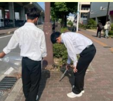
防府駅周辺の清掃活動