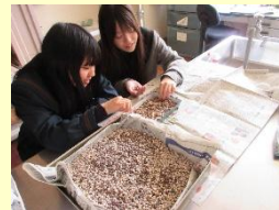
採取した数珠玉を用いたお手玉作り