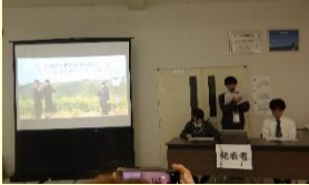
日本ジオパーク全国大会での発表