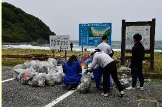
二位ノ浜清掃活動