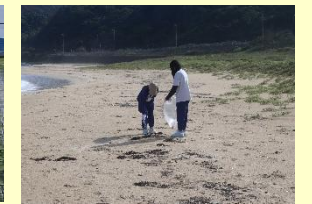
鳴き砂清掃ボランティア