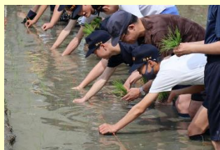
田植え行事「さのぼり」