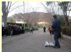
TOSOH PARK 永源山の清掃活動