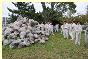
真綿川河川公園の環境清掃活動