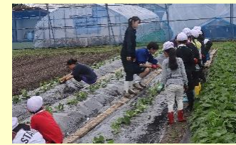
近隣小学校での芋掘り農業体験