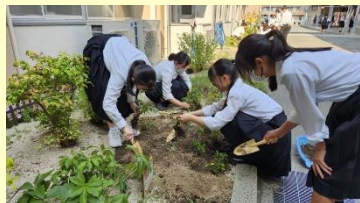
校内の花壇で苗の植え付け