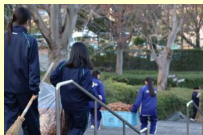
永源山清掃ボランティア