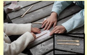
森フェスでの木育啓発活動の様子