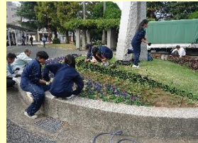
環境美化活動（花壇作成）