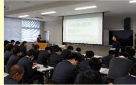
カーボンニュートラル講演会