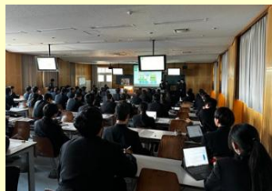
カーボンニュートラルプロジェクト