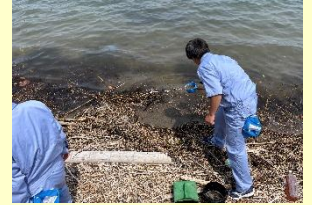
マイクロプラスチックの回収