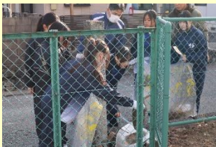
校外環境美化活動