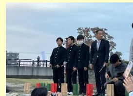
ミズベリングキャンドルナイト点灯式