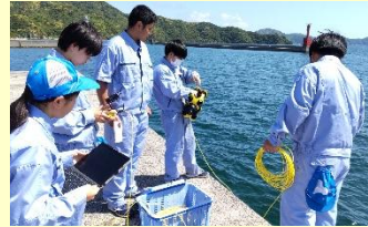
水中ドローンでの海底観察