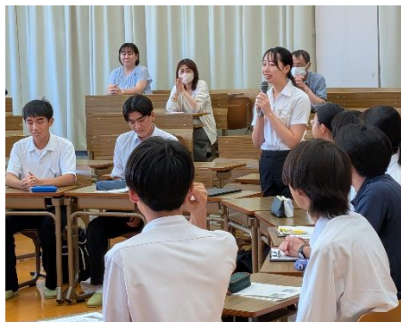
<令和7年度 高校生セミナーの様子>