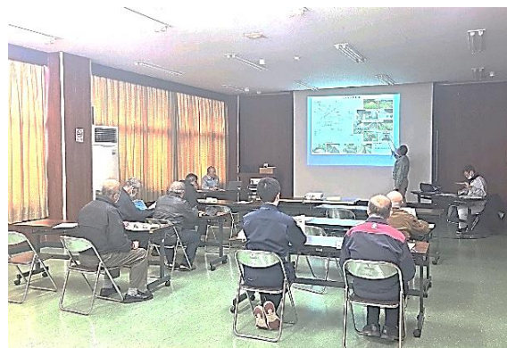
ため池管理者研修会