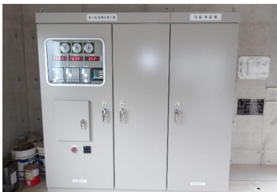
取水設備操作盤補修 (阿惣ダム)