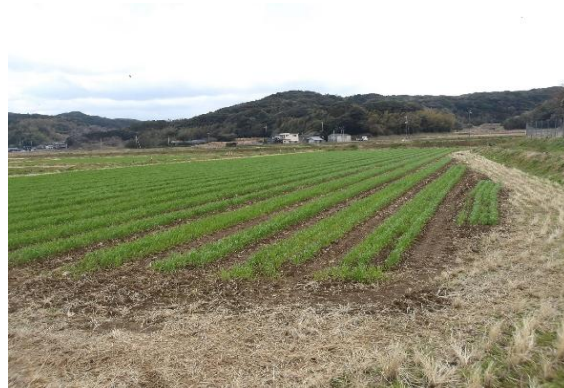
水田高機能化対策ほ場（麦栽培） (本郷)