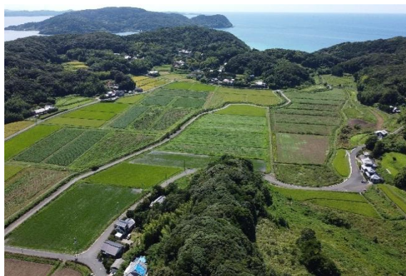
区画整理工事完了 (本郷)