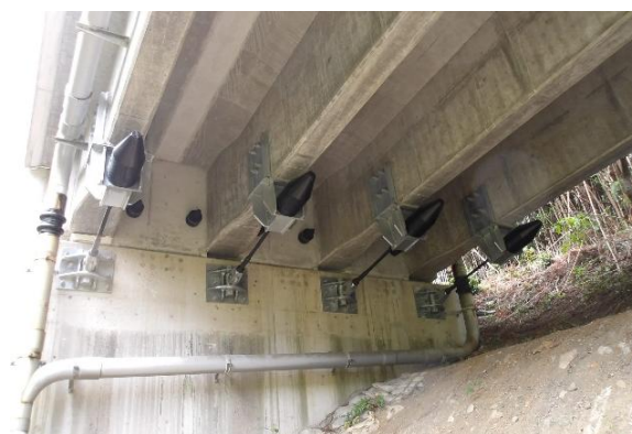
貝川橋落橋防止装置設置 (長門大津)