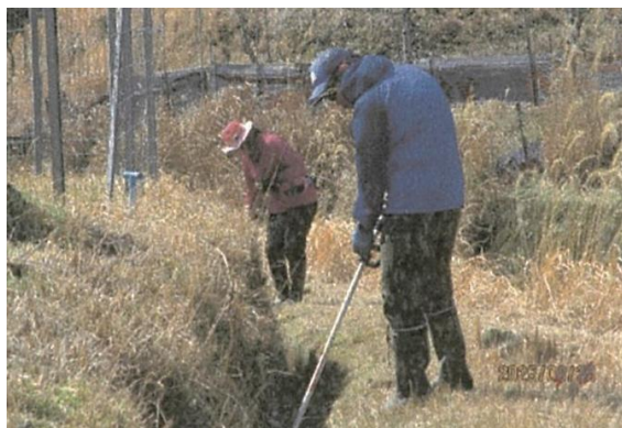
多面的機能支払 (水路管理活動)