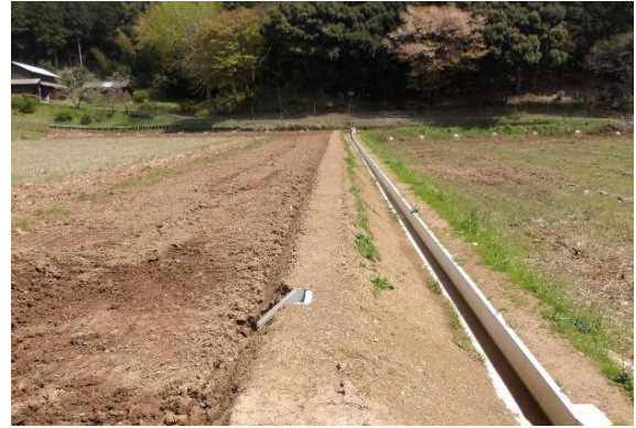
水路整備 (日置東部)