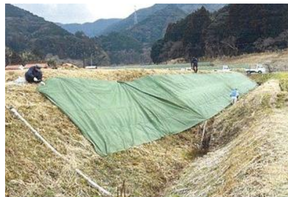
中山間地域等直接支払 (防草シートの張立)