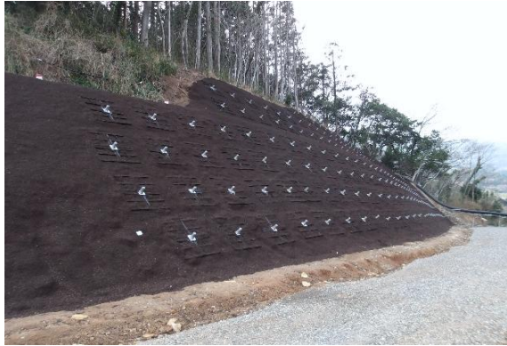
集落道 法面保護工 (新ながと)