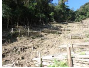
繁茂竹林の伐採（再生竹除去）