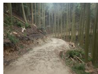
森林作業道の開設

主伐一再造林一貫作業など、低コスト再造林技術の普及・定着に不可欠なコンテナ苗の生産支援に取り組みます。