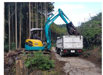
フォレストJV林地残材の回収