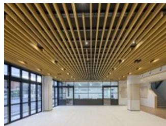
仙崎公民館エントランス

エリートツリーや早生樹を活用した主伐一再造林による森林の若返り、非住宅建築物等における木材利用の促進、森林バイオマスの供給体制整備、森林Jクレジット制度の活用など、森林資源の循環利用、エネルギー利用、CO 2 吸収源対策を推進します。