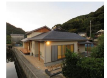
長門市産木材利用住宅

県産木材の新たな需要創出に向け、民間・公共建築物の木造化、内装木質化を進めるとともに、幅広い啓発や理解醸成を通じて、県産木材の利用促進を図ります。