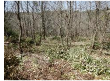
修景伐採（日置千畳敷）