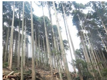
間伐による適切な森林整備