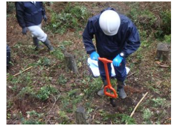
林業サポーター確保研修

造林、保育作業や管理業務を担う労働力の確保に向けて、林業サポーターやデジタル技術を活用できる人材を育成します。