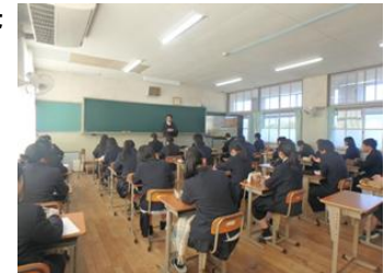
高校生インターンシップ

就業促進専門チームを中心に新規就業者の確保を図るとともに、林業技術研修の受講促進など、定着に向けた支援を行います。