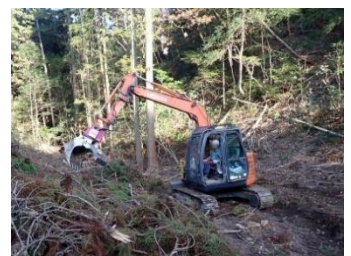
機械地存えによる省力化

主伐一再生造林の定着を図るため、複数の事業体による事業連携「やまぐちフォレストJV」の構築に向けた取組を進めます。