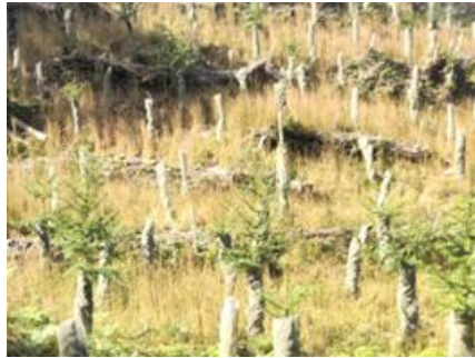
早生樹コウヨウザンの植

森林の有する生物多様性や土砂災害防止、水源かん養等の多面的機能の維持・発揮のため、再造林、間伐等による適切な森林整備を推進します。