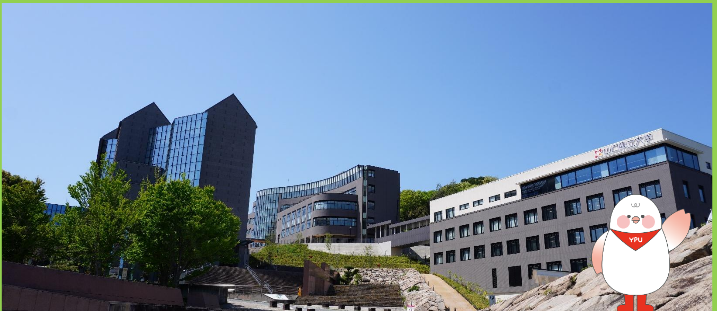
山口県立大学公式マスコットキャラクター 「わいびよ」