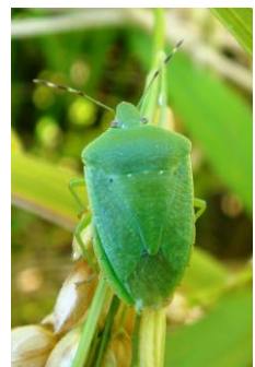
ミナミアオカメムシ 体長 12-16mm