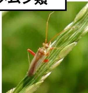
アカスジカスミカメ 体長 4.6-6mm