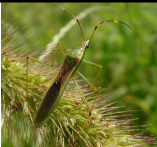
クモヘリカメムシ 体長 15-17mm