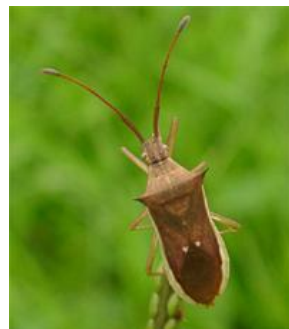
ホソハリカメムシ 体長 9-11mm