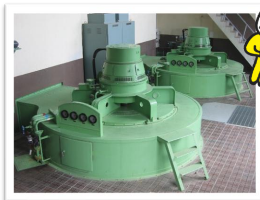
※佐波川発電所発電機