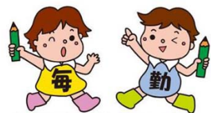
毎月勤労統計調査のキャラクター「まいちゃんきんちゃん」

https://www.pref.yamaguchi.lg.jp/cms/a12500/tingin/maikin.html