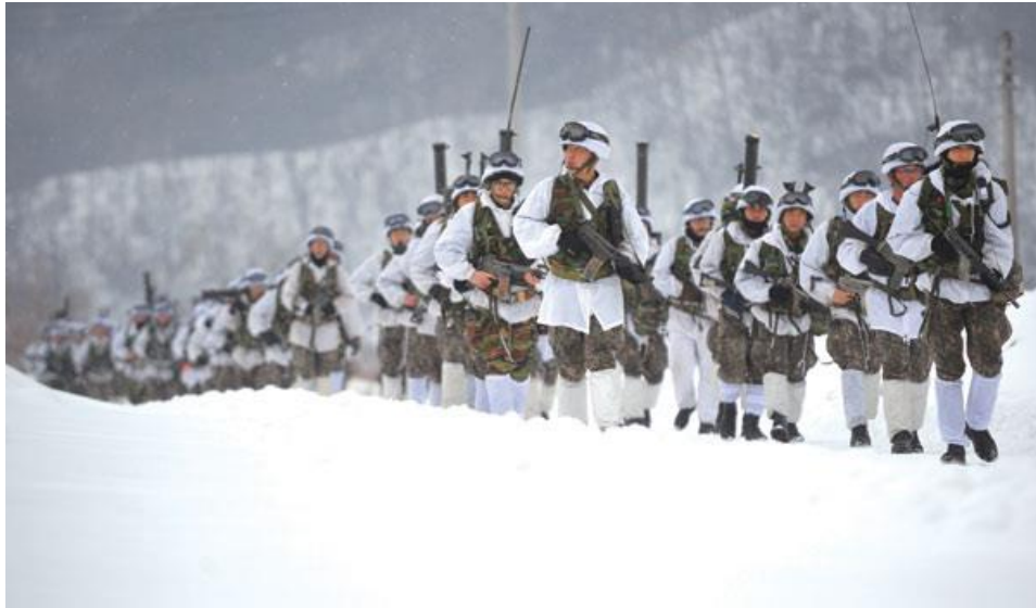
↑ 혹한기 훈련

혹한기 훈련은 말 그대로 가장 추운 시기에 하는 훈련을 말합니다. 40kg 가방을 메고, 훈련장까지 몇 십키로를 걸어간 다음, 야외 훈련장에 텐트를 세우고, 여러 훈련을 받고, 밖에 있는 텐트에서 잡니다. 아침에 받은 우유를 텐트에 넣어 놓으면, 둔기가 되어 있는 것을 확인할 수 있습니다. 보통은 4 박 5 일이지만, 부대에 따라 달라지기도 합니다. 그래도 밖에서는 무조건 잡니다.