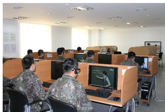
↑サイバー知識情報室

特に売店はお菓子や冷凍食品、カップ麺などを販売していて、高くもない軍人の給料を吸いまくる場所です。(2021年の軍人の給料は平均36万ウォンで、2013年の給料の約