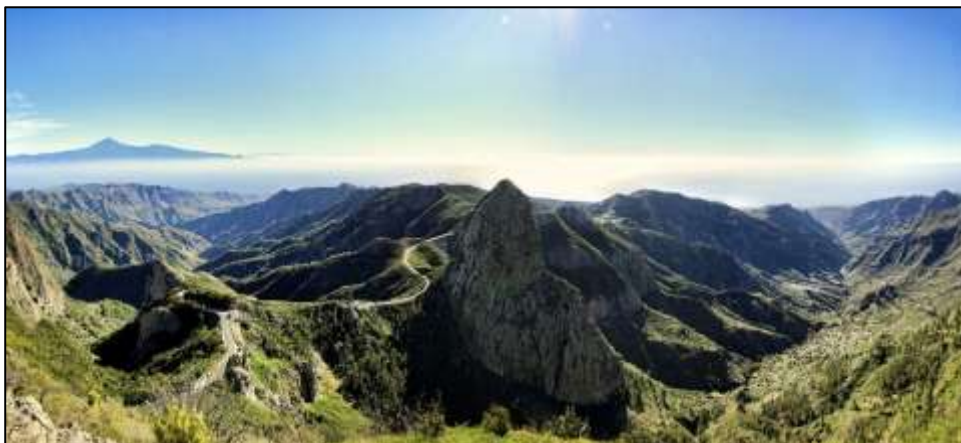
ラ・ゴメラ島の風景