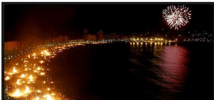
ガリシア州で最も盛り上がるリアソールビーチの聖ヨハネ前夜祭

な儀式があります。「ケイマダ」は一つの儀式に従って陶器のボウルに入れた蒸留酒に火をつけて作る飲み物です。この儀式で炎があがったら魔除けの呪文 じゅもん を現地の言葉ガリシア語で言います。