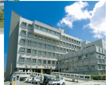
酒田医療センター

本県も独法化にあたっては、その経営形態のメリットを十分に活かし、地域医療の充実と、健全な病院経営の両立を目指して検討・準備を進めていきます。