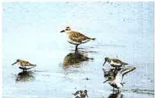
生息・生育地サービス