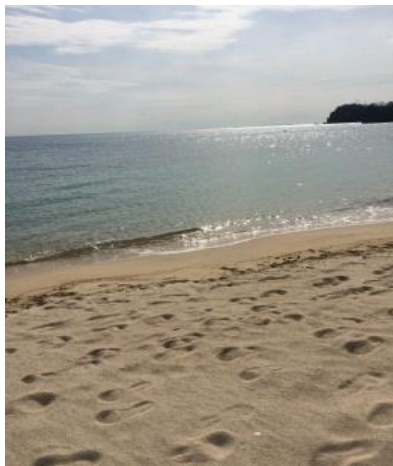
貴船 陸(周防大島町 片添ヶ浜)