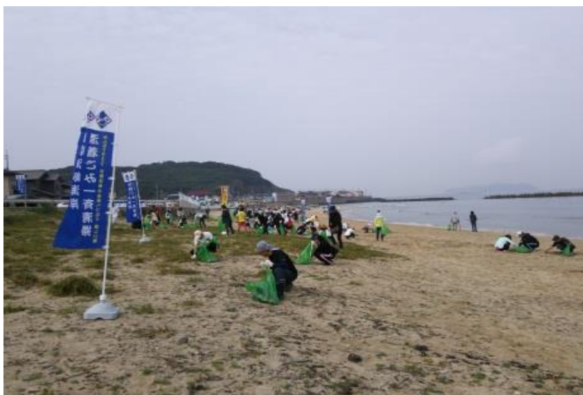
杉山 由美子(下関市 綾羅木海岸)