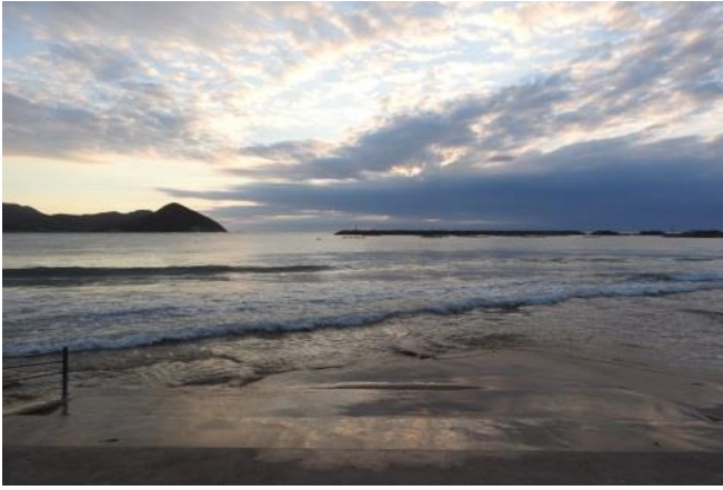
平井 智美(下関市 黒井海岸)