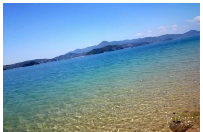
林 杏奈(周防大島町 盛浜)