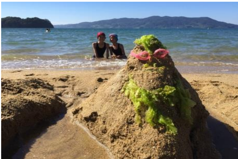
央戸 隆(長門市 伊上海浜公園YYビーチ350)