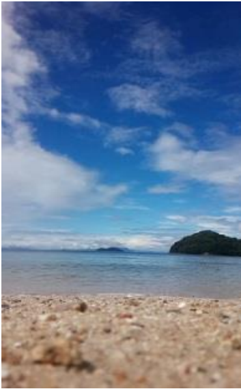
平金 亜美(周防大島町 白浜海岸)