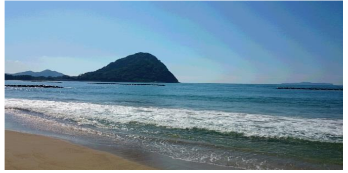
後藤 麗人(萩市 菊ヶ浜)