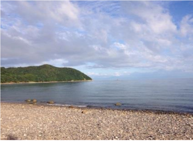
千年 雅也(周防大島町 秋の海)