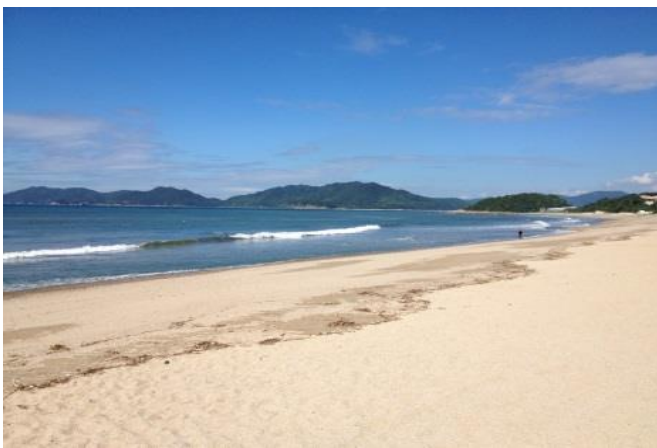
津川 洋介(光市 虹ヶ浜)