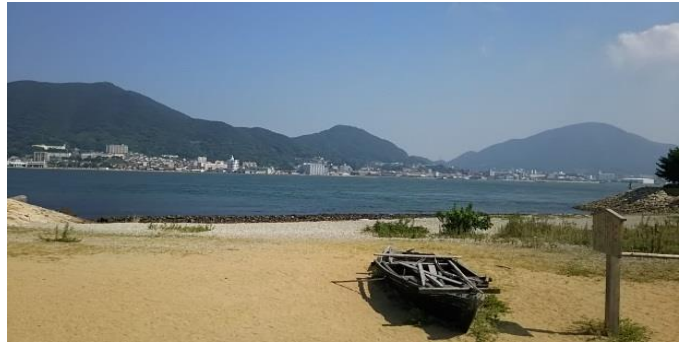
木原 昌紀(下関市 巖流島)