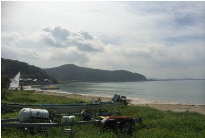
宮尾 昌士(下関市 吉見海岸)