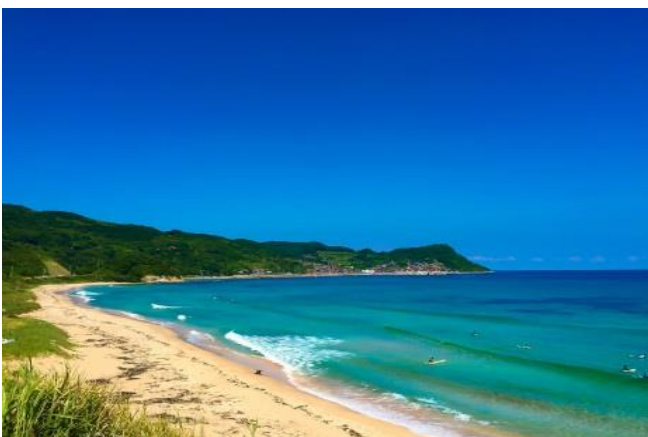
田中 友之(長門市 大浜海岸)