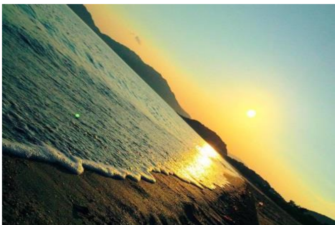
門前 玲奈(長門市 大浜)