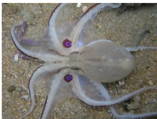
41 ヨツメダコ Octopus areolatus de Hann, 1840。下関市蓋井島地先, 2007年4月6日, 写真のみ。