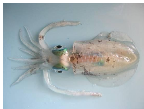
24 アオリイカ (シロイカ) Sepioteuthis lessoniana Férussac in Lesson, 1832. 69mmML, 長門市仙崎地先, 2012年10月9日, 山本健也採集, 萩博物館所蔵 (液浸:HH-Mo. 00554)。