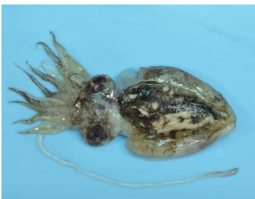
3 ハリイカ (コウイカモドキ) Sepia (Rhombosepion) madokai Adam, 1939. 45mmML, 下関市吉見沖 (水深30m), 2012年9月27日, 園山貴之採集, 萩博物館所蔵 (液浸:HH-Mo.00147), 写真 (石丸太一撮影)。