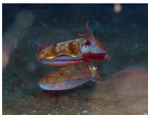
11 スジコウイカ Sepia (Doratosepion) tokioensis Ortmann, 1888. 約100mmML, 長門市青海島地先, 2008年1月13日, 写真のみ。