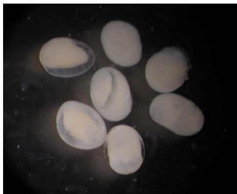
25 ホタルイカ (卵) Watasenia scintillans (Berry, 1911)。1.3~1.5mm 長径, 萩市見島北西沖, 1996年4月10日, 渡辺俊輝採集, 萩博物館所蔵 (液浸:HH-Mo.00547), 写真 (河野光久撮影)。