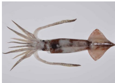
30 スルメイカ Todarodes pacificus Steenstrup, 1880。225mmML, 長門市通地先, 2012年10月26日, 河野光久採集, 萩博物館所蔵 (液浸:HH-Mo.00752)。