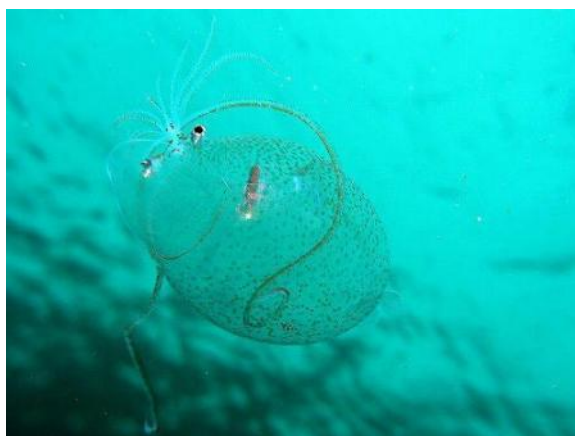
36 ゴマフホウズキイカ Helicocranchia pfefferi Massy, 1907。長門市青海島地先, 2009年4月20日, 写真のみ。