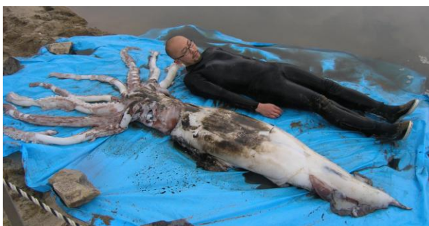
29 ダイオウイカ Architeuthis martensii (Hilgendorf, 1880)。約1.2mML, 長門市油谷川尻, 2007年2月6日, 岡本和徳採集, 萩博物館所蔵 (液浸:HH-Mo.5108), 写真 (萩博物館撮影)。