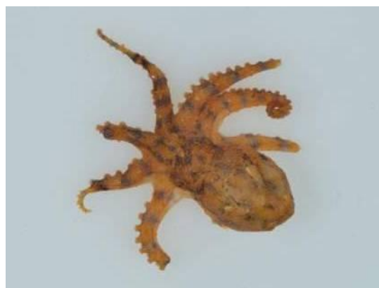
42 ヒョウモンダコ Hapalochlaena fasciata (Hoyle, 1886)。22mmML, 仙崎湾, 2011年7月29日, 森下敏夫採集, 萩博物館所蔵(液浸:HH-Mo.5102), 写真(内田喜隆撮影)。