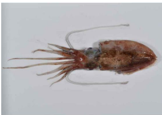
9 ウデボゾコウイカ Sepia (Doratosepion) tenuipes Sasaki, 1929. 85mmML, 萩市見島西沖, 2012年10月25日, 山本健也採集, 萩博物館所蔵 (液浸:HH-Mo.01920)。