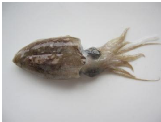
4 エゾハリイカ Sepia (Doratosepion) andreana Steenstrup, 1875. 55mmML, 長門市油谷津黄沖, 2012年5月23日, 写真のみ。