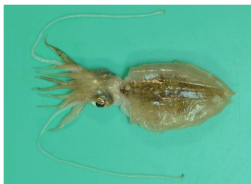
5 ヒメコウイカ Sepia (Doratosepion) kubiensis Hoyle, 1885). 61mmML, 山口県西沖 (対馬東沖), 2012年9月24日, やまぐち丸採集, 萩博物館所蔵 (液浸:HH-Mo.00484)