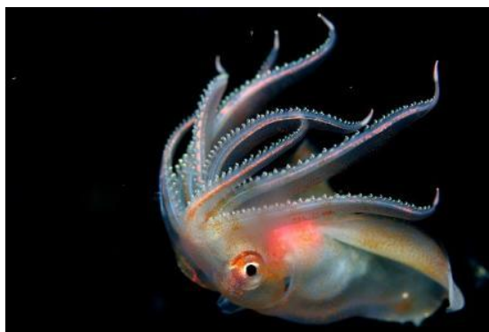
28 ヤツデイカ Octopoteuthis sicula Rüppell, 1844。長門市青海島地先, 2010年5月20日, 写真のみ。