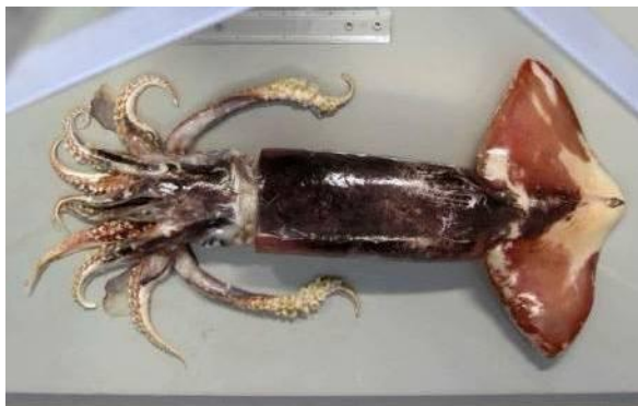
31 アカイカ Ommastrephes bartramii (Lesueur, 1821)。412mmML, 長門市三隅野波瀬地先, 2005年1月30日, 萩博物館所蔵(液浸:HH-Mo. 3589), 写真(堀成夫撮影)。