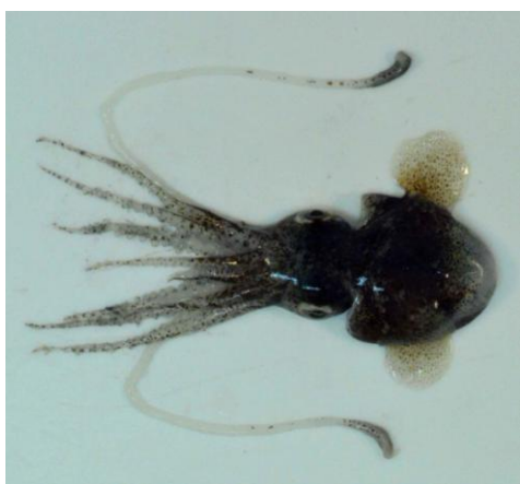
17 ミミイカ Euprymna morsei (Verrill, 1881)。22mmML，仙崎湾，2012年 10月 24日，天社博之採集，萩博物館所蔵（液浸：HH-Mo. 00557）。