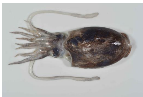
14 シリヤケイカ Sepiella japonica Sasaki, 1929。122mmML，長門市通地先，2012年 10月 26日，萩博物館所蔵（液浸：HH-Mo. 00753），写真（石丸太一撮影）。