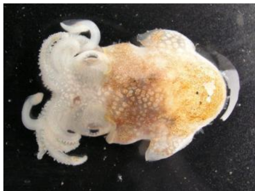
15 ミミイカダマシ Sepiadarium kochii Steenstrup, 1881。22mmML，下関市豊浦町室津地先，2007年 4月 17日，写真のみ。