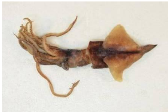
26 ホタルイカモドキ Enoploteuthis ( Paraenoploteuthis ) chunii Ishikawa, 1914。67mmML, 隠岐北沖*, 2012年7月25日, 島根県水産技術センター採集, 萩博物館所蔵 (液浸:HH-Mo.00551)。*山口県日本海域ではないが, 近隣海域のため参考写真として掲載した。