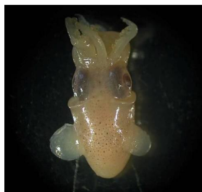
16 ダンゴイカ Sepiolo birostrata Sasaki, 1914。8mmML，長門市油谷川尻沖，1988年 5月 17日，河野光久採集，萩博物館所蔵（液浸：HH-Mo. 00492），写真（河野光久撮影）。