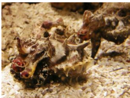
13 ハナイカ Metasepia tullbergi (Appellöf, 1886)。約 50mmML，下関市豊浦町室津地先，2003年 5月 20日，写真のみ。