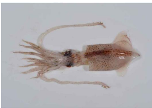
27 カギイカ Moroteuthis loennbergii Ishikawa & Wakiya, 1914。対馬北東沖 (山口県北西沖), 2012年10月25日, やまぐち丸採集, 萩博物館所蔵 (液浸:HH-Mo.01921)。