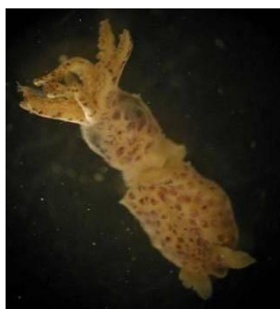
18 ヒメイカ Idiosepius paradoxus (Ortmann, 1881)。4mmML，長門市油谷川尻沖，1989年 7月 13日，河野光久採集，萩博物館所蔵（液浸：HH-Mo. 00546）。