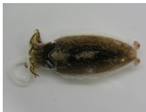
12 ミサキコウイカ Sepia (Doratosepion) misakiensis Wülker, 1910. 下関市豊浦町室津地先, 2007年4月11日, 写真のみ。