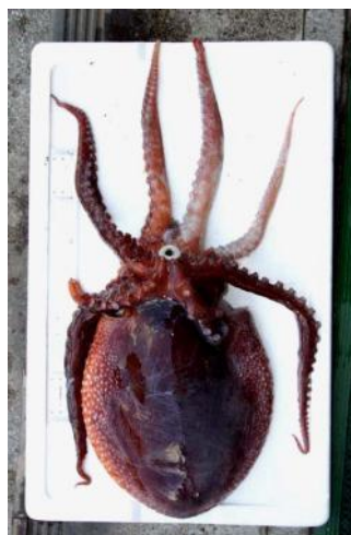
45 アミダコ Ocythoe tuberculata Rafinesque, 1814。250mmML, 萩市越ヶ浜嫁泣漁港, 2004年1月 29日, 内田正男・小池松利・楳本博昭採集, 萩博 物館所蔵(液浸:HH-Mo.5104), 写真(堀 成夫撮 影)。