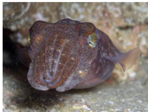
10 ボウズコウイカ Sepia (Doratosepion) erostrata Sasaki, 1929. 50~60mmML, 長門市青海島地先, 撮影日不明, 写真のみ。