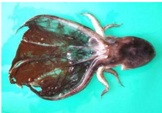
44 ムラサキダコ Tremoctopus violaceus gracialis (Eydoux & Souleyet, 1852)。170mmML, 長門市三 隅野波瀬漁港, 2006年9月15日, 写真のみ。