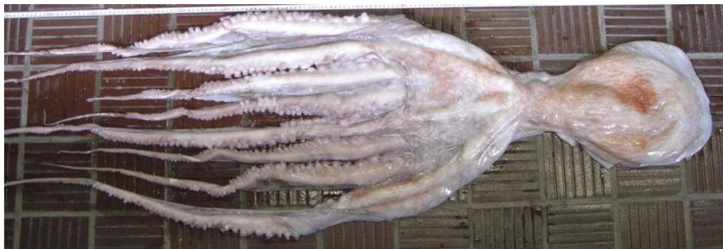
43 ミズダコ Octopus (Enteroctopus) dofleini (Wüker, 1910)。325mmML, 萩市見島沖, 2010年1 月27日, 写真のみ。