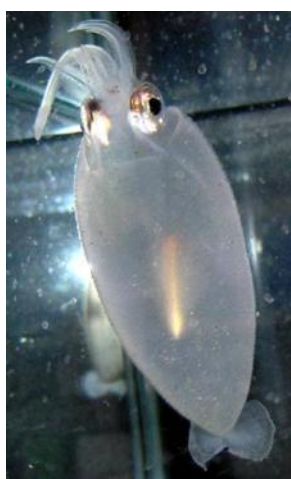
35 サメハダホウズキイカ Cranchia scabra Leach, 1817。75mmML, 阿武町筒尾地先, 2007年4月29日, 萩博物館所蔵(液浸:HH-Mo. 5080)。