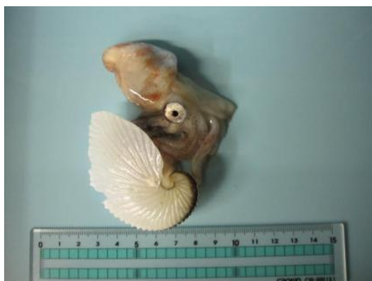
46 アオイガイ Argonauta argo Linnaeus, 1758。 37mmML, 長門市沖, 2010年9月4日, 写真のみ(河 野光久撮影)。