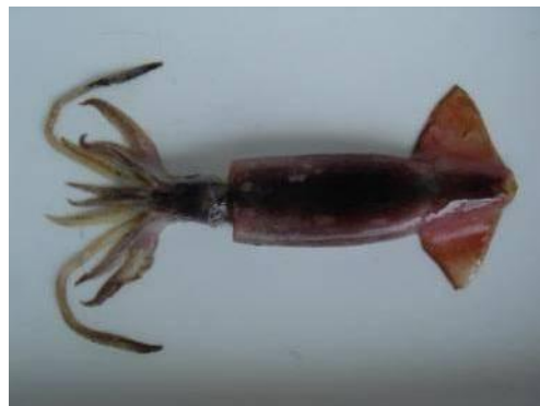
32 トビイカ Sthenoteuthis oualaniensis (Lesson, 1830)。121mmML, 長門市沖, 2008年7月30日, 写真のみ(河野光久撮影)。