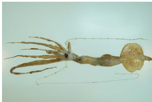
34 ユウレイイカ Chiroteuthis (Chirothauma) picteti Joubin, 1894。199mmML, 見島北西沖, 2012年10月12日, 落合晋作採集, 萩博物館所蔵(液浸:HH-Mo. 00751)。