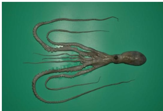
38 テナガダコ Octopus minor (Sasaki, 1920)。60mmML, 下関市彦島沖, 2012年11月2日, 土井啓行採集, 萩博物館所蔵(液浸:HH-Mo.05488), 写真(石丸太一撮影)。