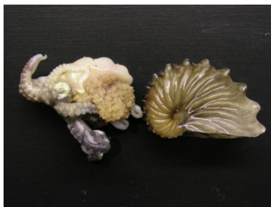
47 タコブネ Argonauta hians (Lightfoot, 1786), 1881。下関市豊浦町室津地先, 2006年10月12日, 写真のみ。