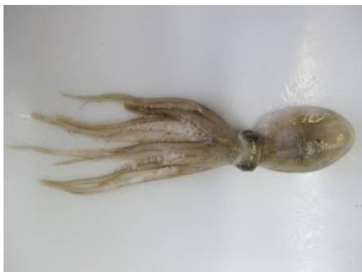
39 スナダコ Octopus kagoshimensis Ortmann, 1888。30mmML, 長門市油谷津黄沖, 2012年7月9日, 写真のみ。