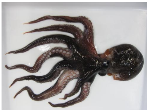
37 マダコ Octopus vulgaris Cuvier, 1797。80mmML, 下関市豊浦町小串漁港, 2012年10月17日, 松尾圭司採集, 萩博物館所蔵(液浸:HH-Mo.00560)。