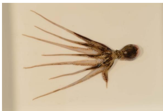
40 イイダコ Octopus ocellatus Gray, 1849。35mmML, 仙崎湾, 2012年10月16日, 天社博之採集, 萩博物館所蔵(液浸:HH-Mo.00559), 写真(石丸太一撮影)。