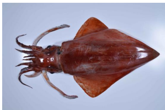
33 ソデイカ Thysanoteuthis rhombus Troschel, 1857。429mmML, 長門市通地先, 2012年10月26日, 河野光久採集, 萩博物館所蔵(液浸:HH-Mo. 01922)。