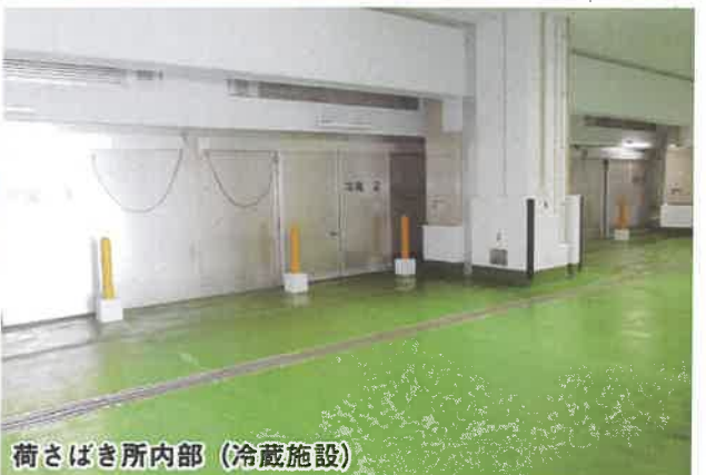
荷さばき所内部(冷蔵施設)