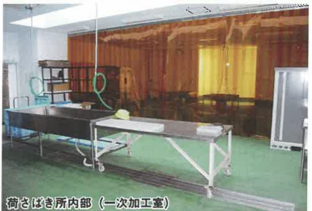
荷さばき所内部(一次加工室)