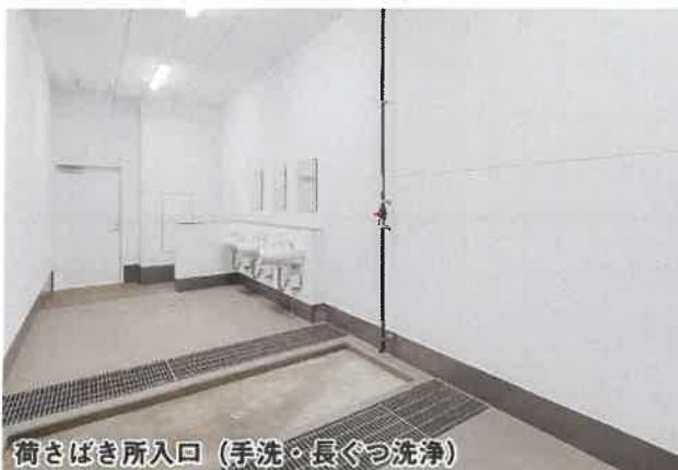
荷さばき所入口(手洗・長くつ洗浄)