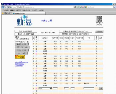
派遣会社向け勤務管理システムの画面例