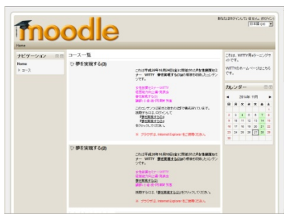
山口県女性創業サポート事業の e ラーニングサイト