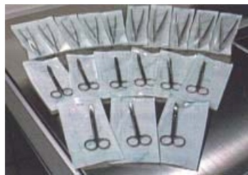
包装済み医療器具