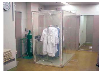
衣服などの脱臭ブース