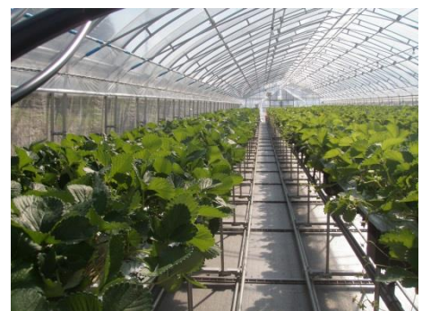
●らくラック（固定式）