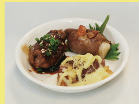
シカの肉巻きライスケーキ ～3種の味を添えて～

このほかにも、家庭でおいしく簡単にできるジビエ料理のレシピを、山口県のホームページで紹介しています。