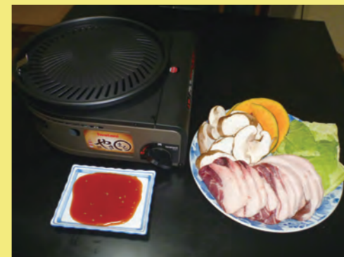
イノシシ肉の焼肉