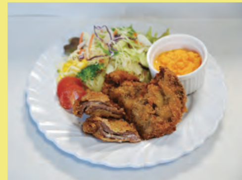
チーズInシカフライ (にんじんソース付き)