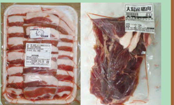
イノシシ精肉（ロース肉スライス）