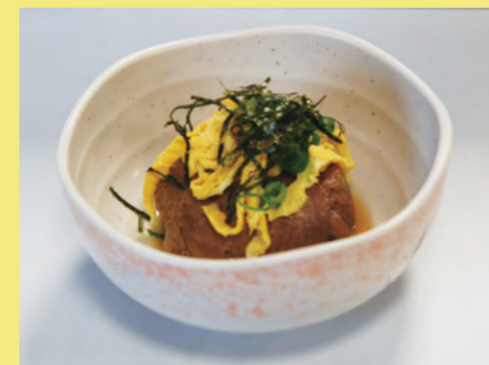
シカ肉のロール茶そば