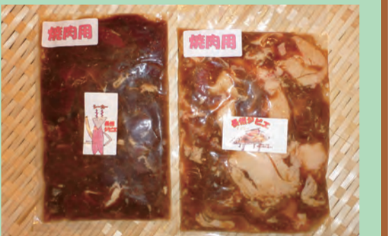
イノシシ、シカ焼肉用味付肉