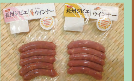
イノシシ、シカのウインナー