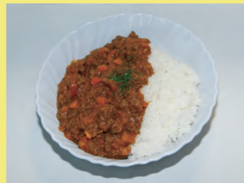
イノシシ肉&シカ肉入り ドライカレー