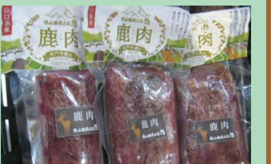
シカ精肉（背ロース）