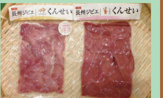
イノシシ、シカのくんせい