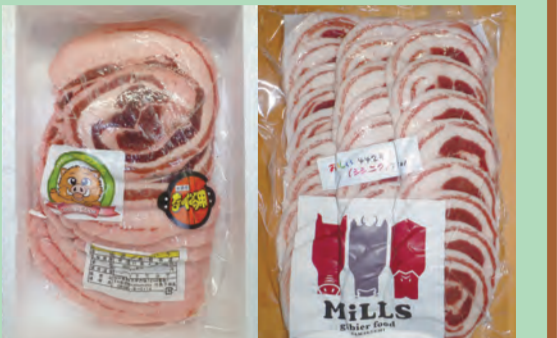
イノシシ精肉（ばら肉スライス）