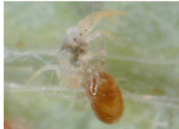
ナミハダニを食べるミヤコカブリダニ