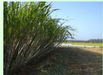
再生作業後 (サトウキビ栽培)

問い合わせ先:芦北町担い手支援総合協議会 0966-82-2511(代表)(農林水産課)