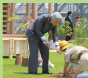
天皇后陛下によるお手植え、お手播き