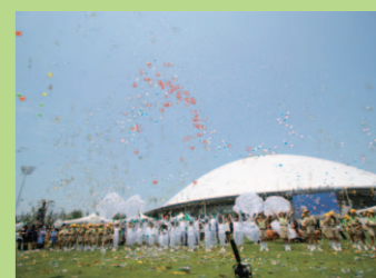
式典行事のフィナーレ