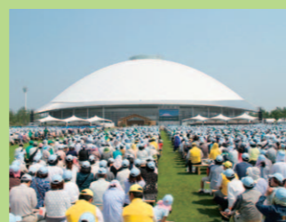
県内外からたくさんの方が参加した式典会場

5月27日(日)快晴のもと「山口きらら博記念公園」において、天皇后陛下のご臨席を賜り、式典行事を開催しました。 県内外の招待者約1万人のご参加をいただき、天皇后陛下によるお手植え、お手播きや各種表彰のほか、開催テーマ「育むいのち ～彩りの森・光る海・碧い空 燦めきの発進～」を表現するアトラクションを行いました。 また、東日本大震災復興支援として、東北3県(岩手県、宮城県、福島県)に山口県で生産した緑化樹木を贈呈しました。