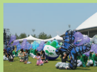
アトラクションでは「やまりん」も大活躍