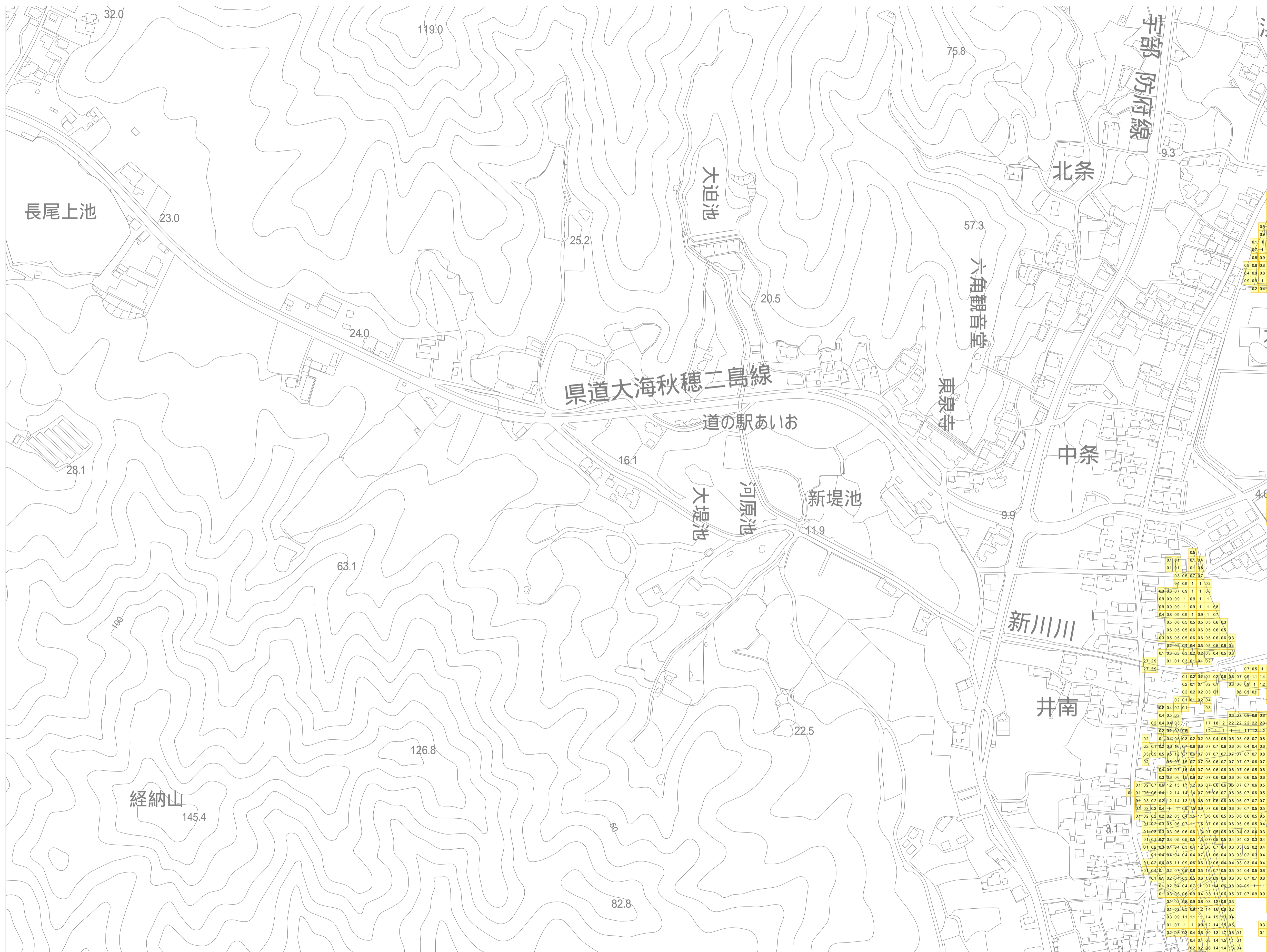
この地図は、山口市長の承認を得て、同市発行の山口市都市計画図を複製したものです。(承認番号 平成25年12月2日 都第177号)