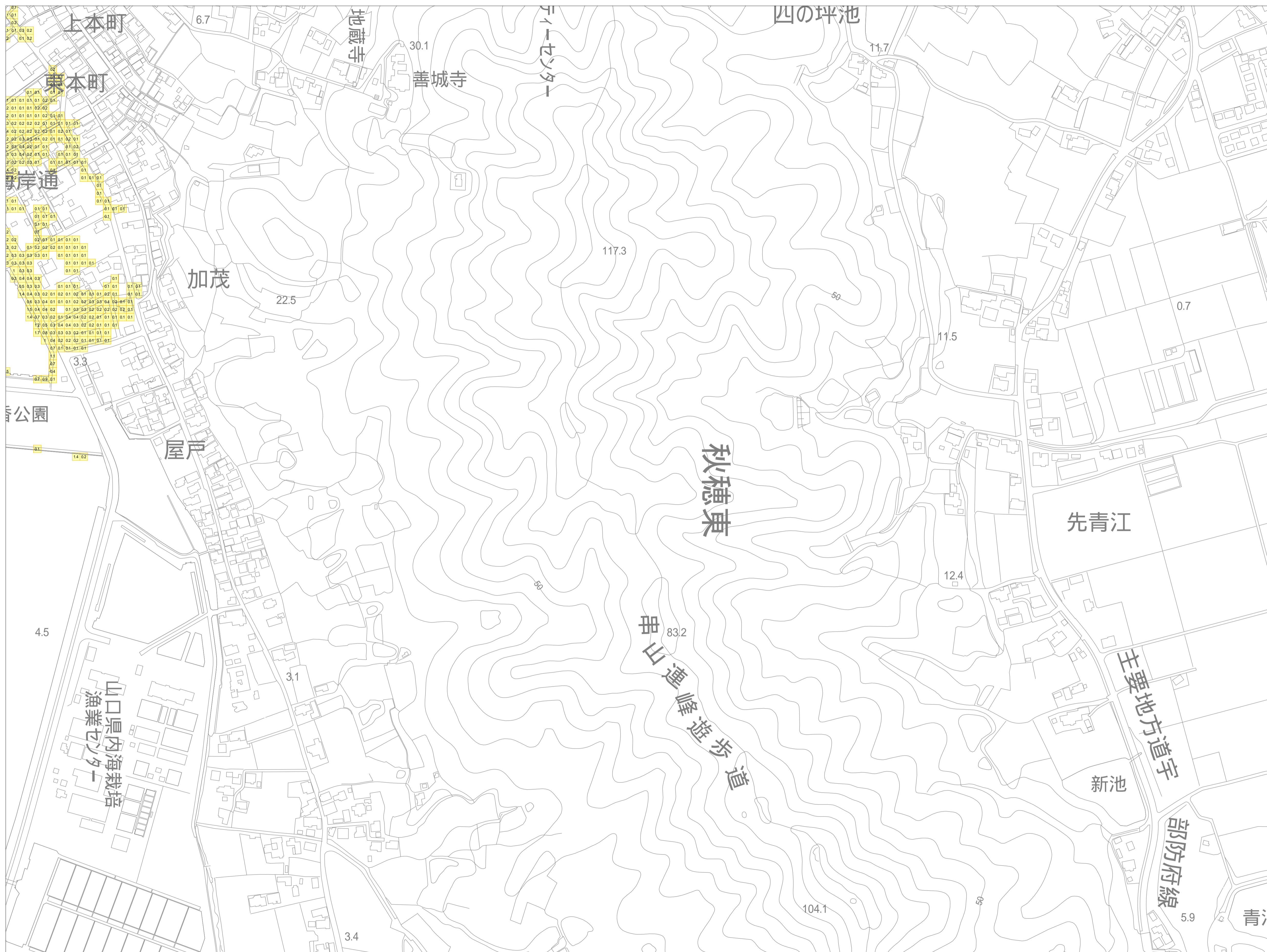
この地図は、山口市長の承認を得て、同市発行の山口市都市計画図を複製したものです。(承認番号 平成25年12月2日 都第177号)