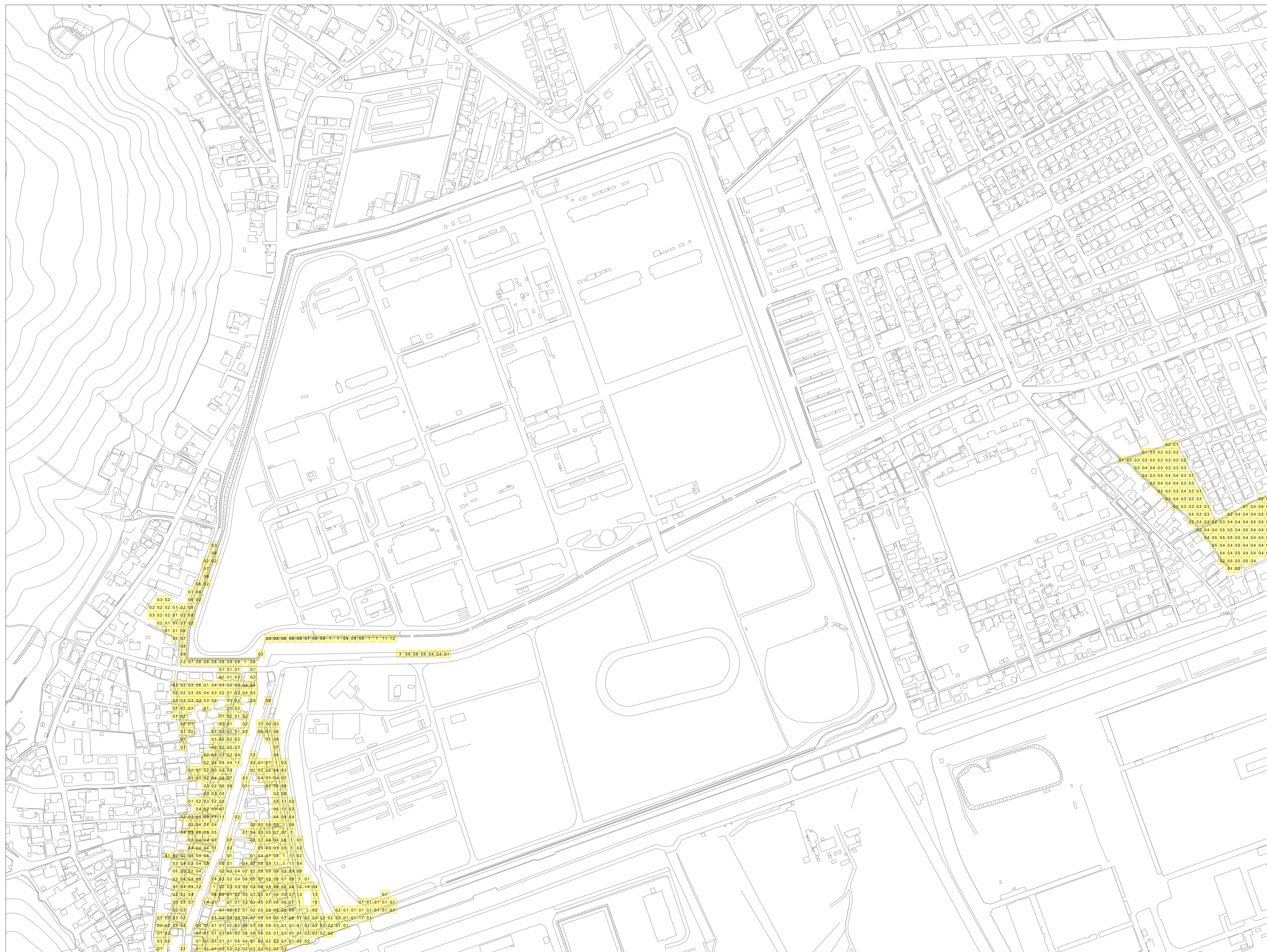
この地図データは、防府市長の承認を得て防府市地形図を使用したものである。