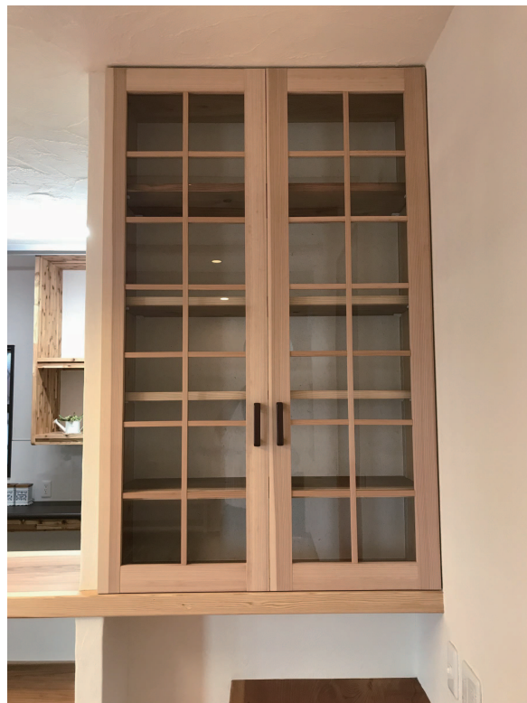
台所カウンター際にある、趣味の物を飾る 造り付けのガラス戸。