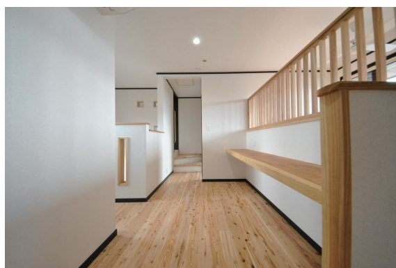
寒くないからできる2階ホールにある 学習スペース。