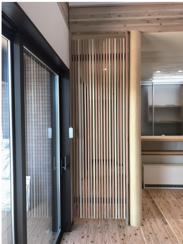
引戸の玄関を入ると目隠しも兼ねる スッキリしたおしゃれな格子。