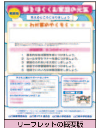
リーフレットの概要版

★「夢をはぐくむ家庭の元気」のリーフレットや概要版は、社会教育・文化財課のウェブページからもダウンロードできます。