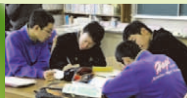
高校生や保護者、地域の方による学習支援

学校・家庭・地域の温かい絆が結ばれ、子どもも大人も生き生きと学ぶ学校をめざします。