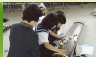
地域の方による琴の演奏指導