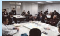
学校関係者や保護者、地域の方による話し合い

「コミュニティ・スクール」に設置されている「学校運営協議会」や中学校区に設置されている「地域協育ネット協議会」で話し合われたことが、よりよい学校づくりや具体的な取組につながっています。