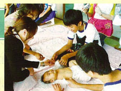
心の教育(赤ちゃんふれあい体験)

県教委では、いじめ問題の解決に向け、次のような取組を行い、いじめの根絶に向け積極的に取り組んでまいります。