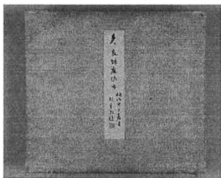
手鑑「多々良の麻佐古」表紙