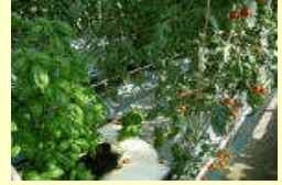
コンパニオンプランツ利用