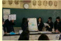
環境学習(グループ学習)