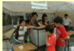
ひかりエコフェスタ(マイクロバブル実験)