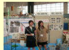
いきいきエコフェア