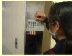
めざせマイナス6%運動