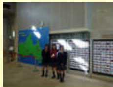
ふるさとの音100選 (DVD作成)