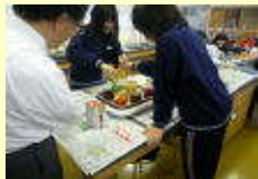
総合的な学習の時間