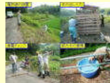
羊を放牧して除草