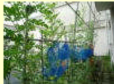
西瓜のグリーンカーテン