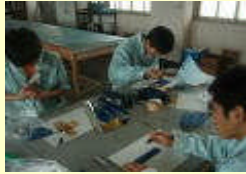
ダイオキシン・カーボンナノチューブ模型作成