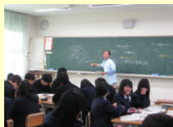
太陽光パネルを活用した授業