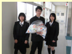
集まったエコキャップ