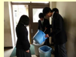
「持出用ゴミ箱」によるゴミの回収