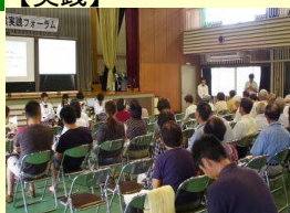
地域循環型農業実践フォーラム