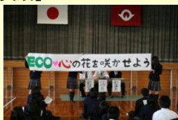
行動宣言（生徒総会）