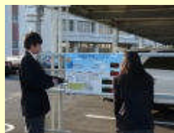
太陽光発電量の記録