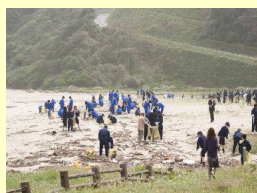
二位ノ浜の海岸清掃