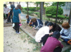
理科の授業での栽培