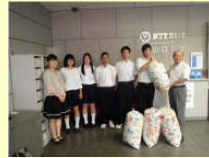
エコキャップ贈呈