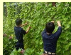
グリーンカーテン