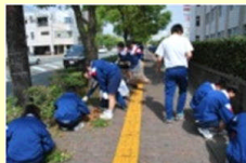
学校周辺の美化作業