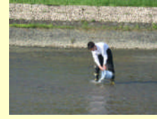
田布施川水質調査