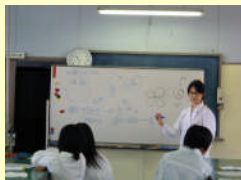
公開講座（中学生対象）