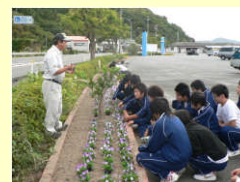
道の駅花壇緑化活動