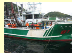
実習における環境教育