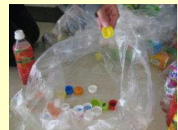
ペットボトル分別