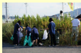
不法投棄撲滅キャンペーン