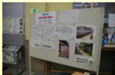
環境掲示板（パネル）