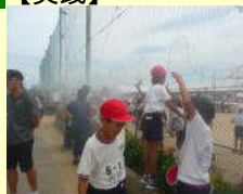
小学校体育祭へのミスト装置貸し出し