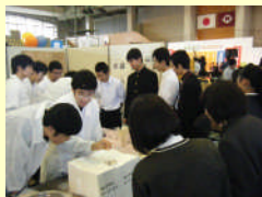
山口県ものづくりフェスタ