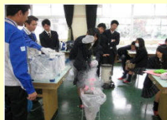
「基礎科学実験」企業の出前授業