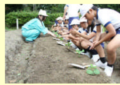
小学生と連携した食育