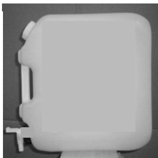
蛇口が1つあるポリタンク

まな板と包丁と鍋は、それぞれ1つずつで、水は、右の写真のような蛇口が1つあるポリタンクに入っているものが使えるだけです。