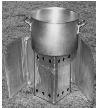
かまどに使う空きかんと鍋

(1) 図1は、キャンプ場所の下見をしたお父さんのメモです。お父さんはテントを張る場所として図1の①～④の4つの地点の中から、④の地点を選びました。お父さんは、①～③の地点をなぜ選ばなかったのでしょうか。考えられる理由を、図1のメモから分かる土地の様子と安全性を関連づけて、それぞれ書きましょう。