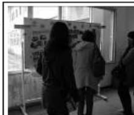
参観日に活動の様子を掲示して周知を図っています。

を販売したりして保護者や地域の方への周知を図っています。教室の活動の様子を見学し、お互い刺激を受けたり、アドバイスをし合ったりして技術の向上を図っています。また、毎年度末には「平生町地域協育ネット運営委員会」全体会を開き、各事業の実績報告、委員やその所属団体同士の交流、情報交換等をして、今後の取組の検討をしています。