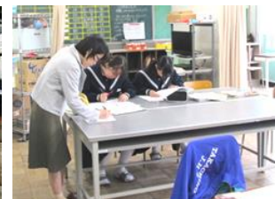
学習支援(高千帆中)