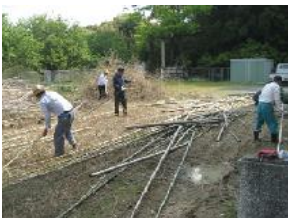
竹林の伐採(高泊小)