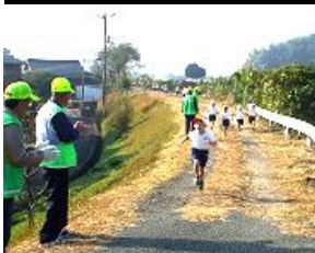
持久走見守り(有帆小)