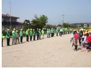
見守り隊対面式(有帆小)