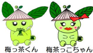
梅っ茶くん 梅茶っこちゃん