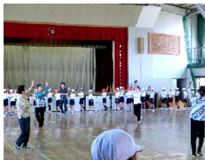
踊りの指導(高千帆小)