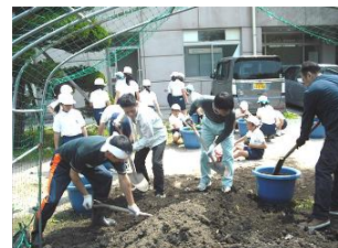
緑のカテン作り(高千帆小)