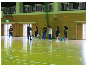
部活動支援(高千帆中)

有帆小学校、高泊小学校は、創立60周年の節目の年でした。運営面でボランティアの皆さんから大きな支援をいただき、当日は盛大な式典となりました。高千帆小学校では、地域の団体・組織が学校支援活動を分担して活動に取り組んでいます。役割がはっきりしているので「人が変わっても活動は続く」というメリットがあります。高千帆中学校では、部活動指導の支援の成果としてバスケットボール部が県選手権大会で優勝し、関係者一同で喜びを分かち合いました。