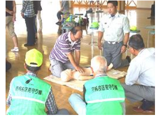
救急救命研修(有帆小)