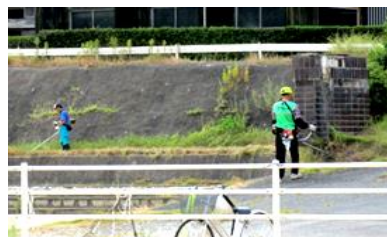
小・中学校ボランティアによる環境整備活動

学校とコーディネーターの連携の在り方、ボランティアの人材育成等が今後の課題です。