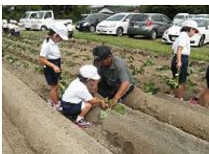
芋の苗植え(高千帆小)