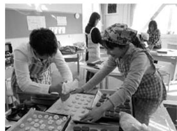
母親委員調理クラブでの「クッキーづくり」

小学6年生と中学2年生は「剣舞」を、また小学5年生は「和太鼓」を、学校支援ボランティアの方に指導していただきました。「剣舞」や「和太鼓」の学習を通して、地域の伝統文化に親しむことができ、その成果を運動会や立志式などで、保護者や地域の方に披露しました。