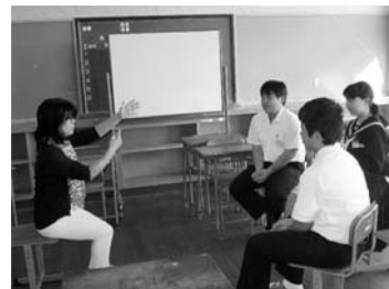
地域の方による「手話」の指導

大島中学校では文化祭に向けた総合的な学習の時間の取組の一つとして、学年の枠を越えて好きな講座を選択し、学習するという「チャレンジタイム」があります。全部で10講座ありますが、地域コーディネーターの紹介により、それぞれの分野で活躍されている地域の方をお招きし、指導を受けました。指導していただいた講座は「ダンス」「フラワーアレンジメント」「手話」などです。