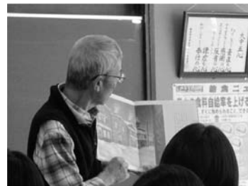
「本の読み聞かせ会」

地域コーディネーターの紹介により、多様な経験や特技をもった地域の方を招き、文化や芸術にふれる中で、地域の方との交流を図ろうと、月に一度「地域とふれあう会」を開催しています。これまで「本の読み聞かせ会」や「三味線を聴く会」を開きました。