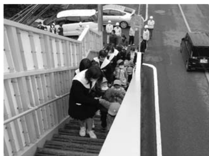
中学生と園児たち