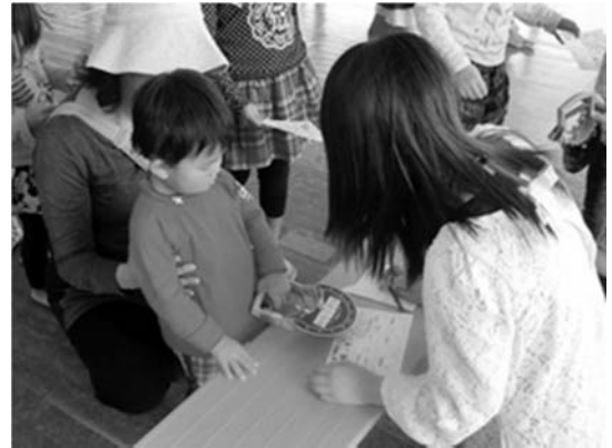
幼児児童を対象にしたイベントでのボランティア