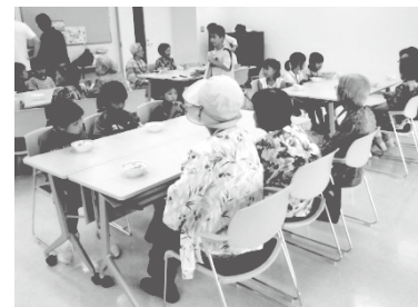
いきいきサロンへの参加

夏季休業中、放課後子ども教室の児童が社会福祉協議会（社協）の主催する「いきいきサロン」へ参加し、レクリエーション活動などを通じてお年寄りとの交流を行いました。活動の後、児童は社協ボランティアさん手作りの昼食をサロンの方と一緒に、話をしながら楽しくいただきました。