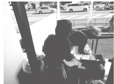
うどんバザーの配膳・片付け

秋に本町で行われる愛ランドフェアの、食生活改善推進協議会（食推）が出店するうどんバザーで、小学5年生～中学生の女子児童生徒が配膳や片付けのボランティア活動を行いました。配膳や片付けをする中で、お客として来られた地域の方々とのコミュニケーションが生まれ、児童生徒は楽しくやりがいがあるといった様子で意欲的に活動していました。