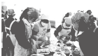
食生活改善推進員との調理実習（小学校、中学校）