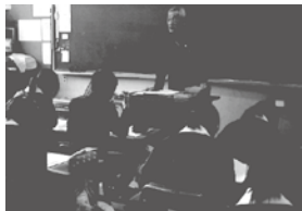
伊佐学（郷土について学習）

地元伊佐について、地域の方から学ぶ「伊佐学」を行いました。また、小学生が中学校で授業を体験したり、中学生が保育実習に取り組んだりしました。