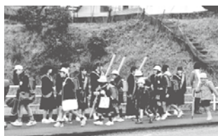
小学校への出前あいさつ運動

中学生が小学校に出向いて共に「あいさつ運動」に取り組みました。地域の高齢者の方とのふれあいなど、様々な年齢の人と交流をしています。