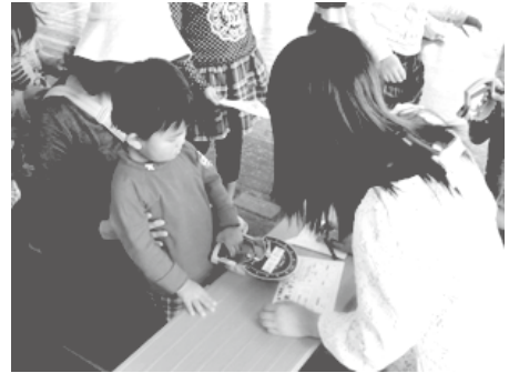
幼児・児童を対象にしたイベントでのボランティア