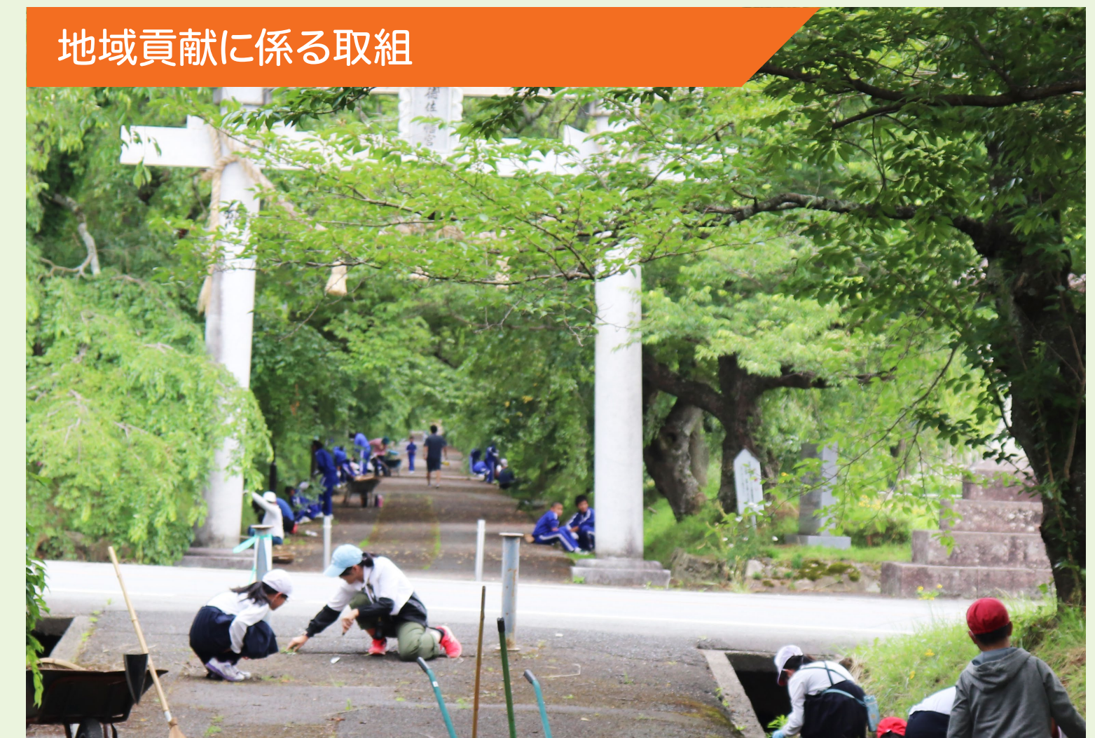
地域貢献に係る取組

毎年、徳佐小学校の5・6年生と阿東東中学校の全校生徒が徳佐八幡宮の参道の清掃活動に取り組んでいる。活動を継続的に行うことで、地域への愛着が確実に高まっている。