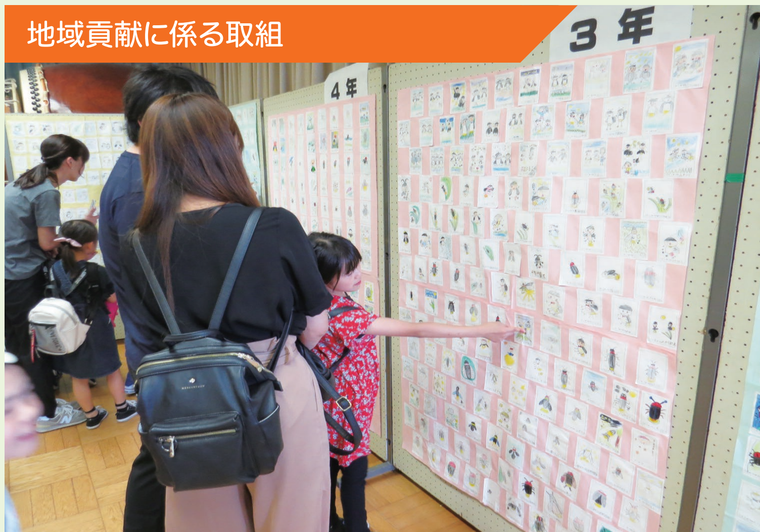
地域貢献に係る取組

6月に地域初の「よしきホタルの夕べ」が開催され、ホテル委員会によるプレゼンテーションや合唱団の演奏、全校児童によるイラスト掲示等の参加協力をし、地域行事を盛り上げた。