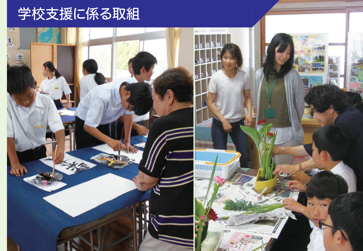
学校支援に係る取組

地域在住の師範の方をお招きして、月に1~2回程度、昼休みに「生け花教室」「書道サークル」を行っている。完成した作品は学校玄関や廊下等に展示され、落ち着いた環境作りにも一役かっている。また、地域の方も生徒との交流を楽しんでいただいている。