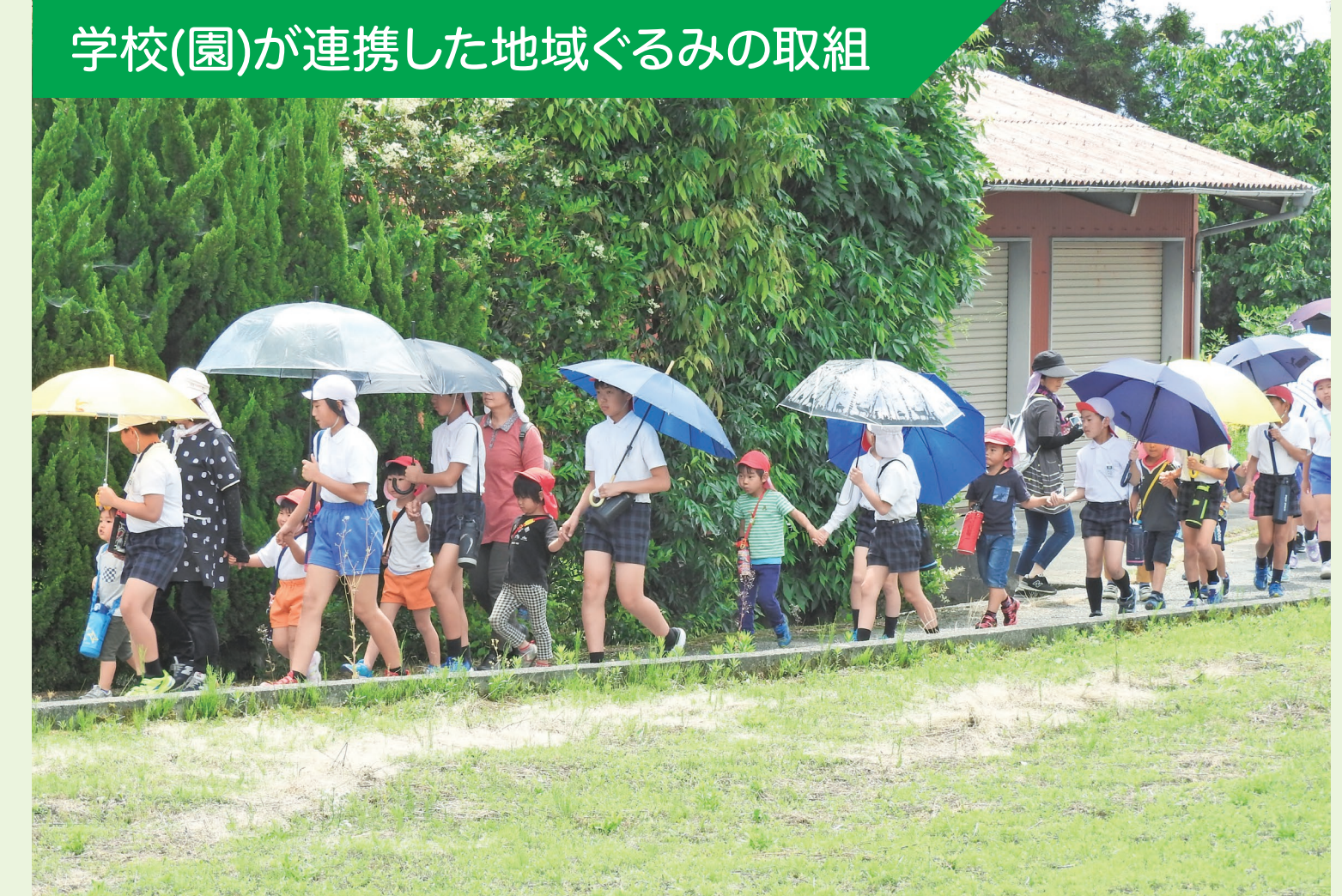
学校(園)が連携した地域ぐるみの取組

保小中地域合同土砂災害想定避難訓練 保育園、小学校、中学校、地域が一体となって土砂災害想定避難訓練を行った。小学生高学年児童は隣の地福保育園に寄って園児を誘導し、その後は阿東中学校に立ち寄り、地域住民の見守りのもと避難場所に避難した。