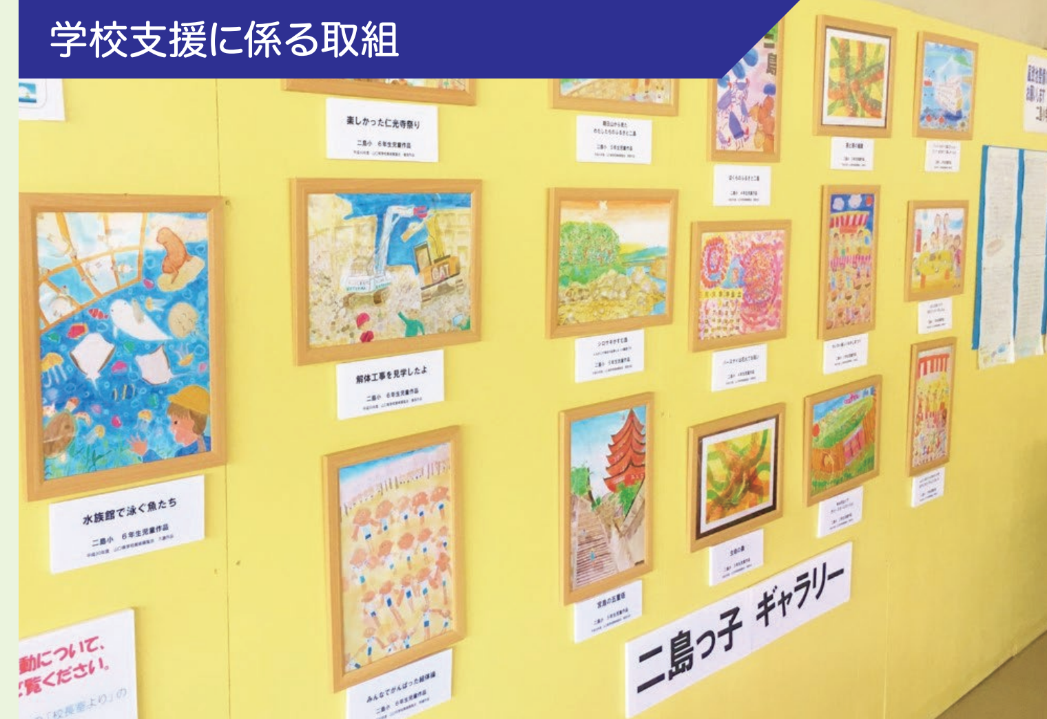
学校支援に係る取組

学校前の店舗内に子どもたちの作品やメッセージを掲示する「わくわく掲示板」や地域の方々と子どもたちを結ぶ「二島っ子ポスト」を設置させていただいている。修学旅行前には地域の方々に千羽鶴の協力を呼びかけ、たくさんの人たちに協力してもらった千羽鶴を平和公園に持っていくことができた。