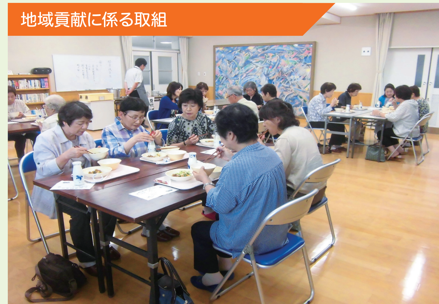
地域貢献に係る取組

地場産給食の日に合わせて地域の方(学校運営協議会の方、見守り隊の方など)に来校していただき、給食試食会を実施した。栄養教諭から地場産食材やメニューについての紹介をし、給食についての理解を深めていただいた。