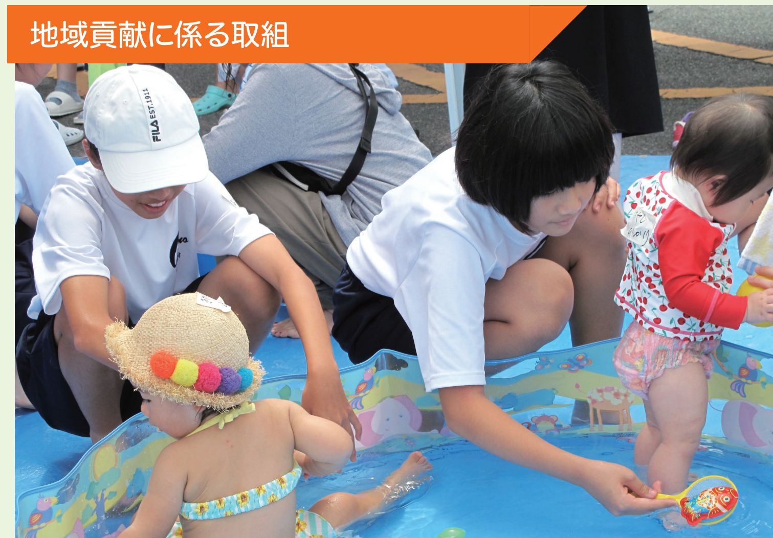
地域貢献に係る取組

地域の子育てサークルの会の8月の定例会で、中学生が水遊びや絵本の読み聞かせなどの企画の手伝いを行った。プールの準備や表示板づくりなどの準備も行い、幼児とのふれあいだけでなく、裏方の仕事にも責任をもって取り組んだ。