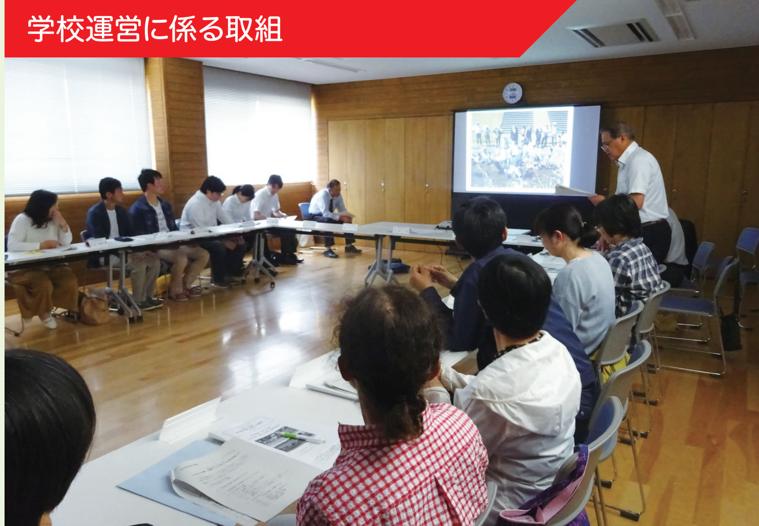
学校運営に係る取組

5月に実施した小中合同学校運営協議会兼地域協育ネット協議会では、新たな試みとして県立大生や山口大学の教職大学院生をオブザーバーとして加え、異なる視点での意見を得ることができた。