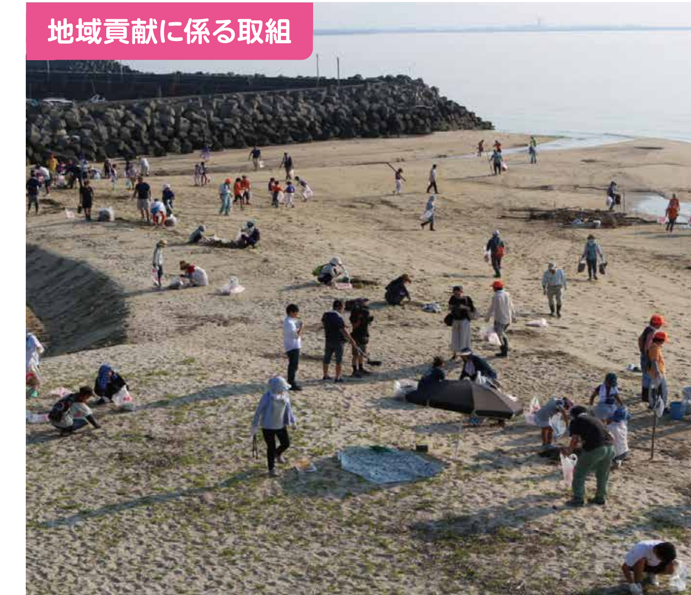
地域貢献に係る取組

昨年度末の「地域協育ネット協議会」で、小学1年生の年度初めの生活支援が検討され、4月の2週間、写真のように実施され、今年度はスムーズにスタートできました。