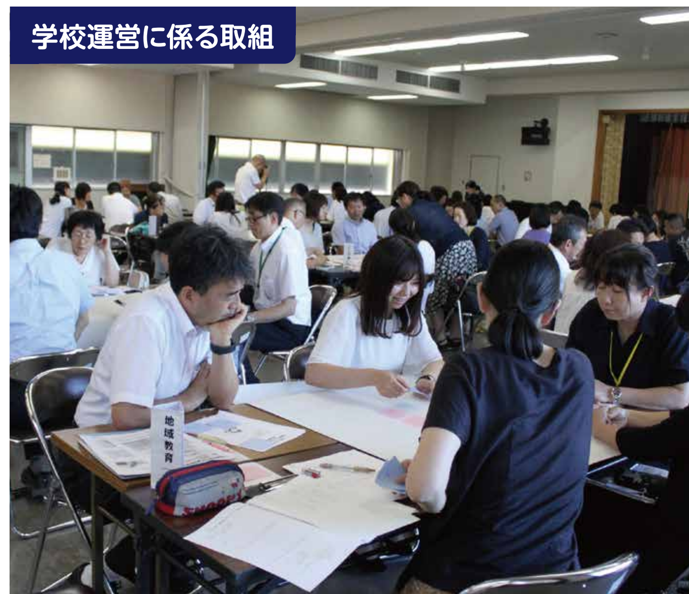
学校運営に係る取組

岩国西中学校区の小中高生や地域、学校、保護者の代表が一堂に会して地域の良さや課題等について話し合う「大人と子どものディスカッション」を毎年行っています。