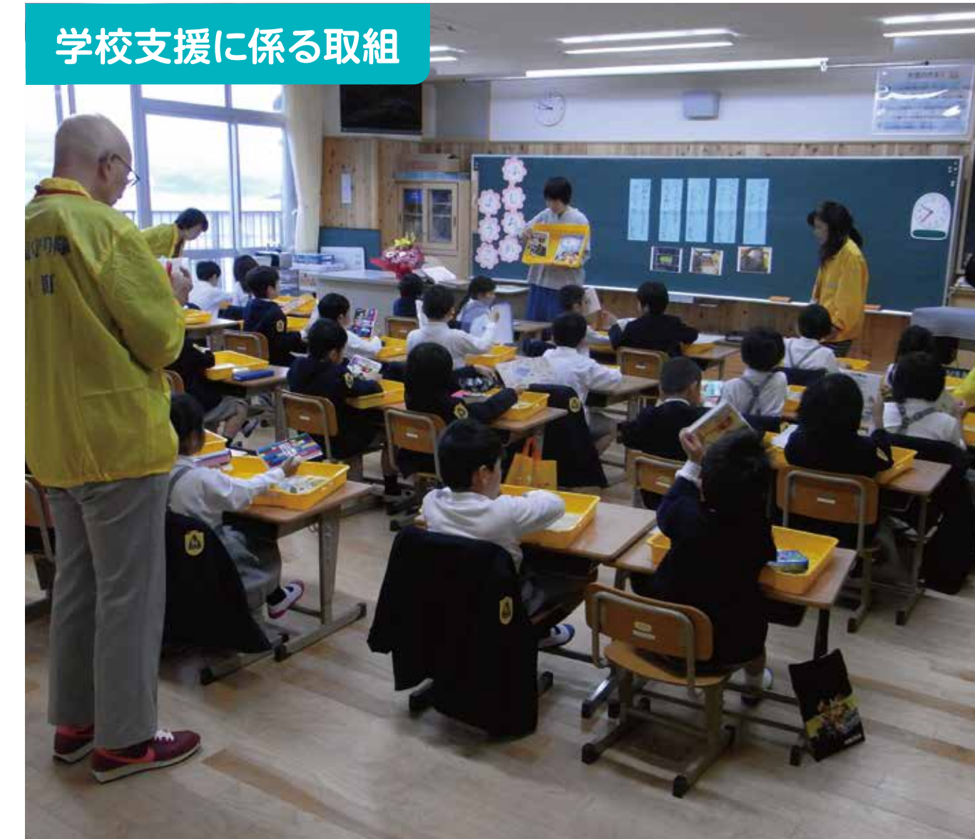
学校支援に係る取組

退職した教育関係者、保健師やスクールソーシャルワーカーの7人が「家庭教育支援チーム」を組んで、子育ての悩みを話し合う保護者向けのサロンを開いています。