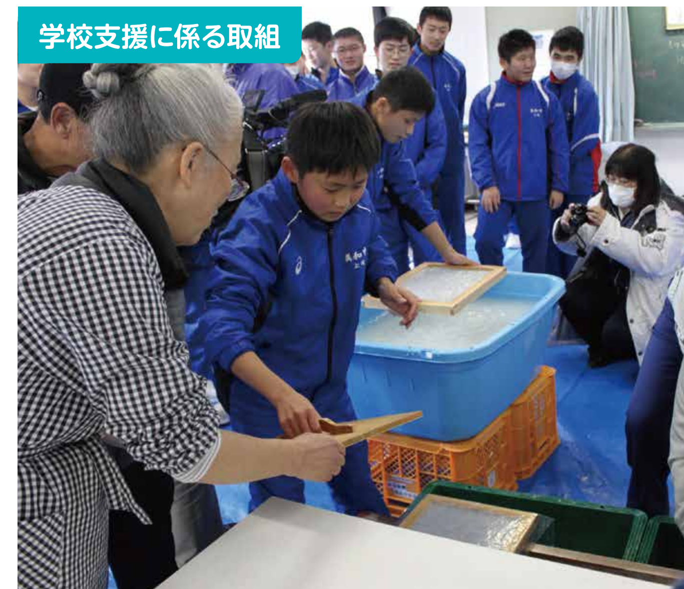
学校支援に係る取組

岩国中学校区の5校で、「岩国きんたいきょうネット全体研修会」を総勢110数名で開催しています。その後半に「グループ研修」として熟議を行っています。