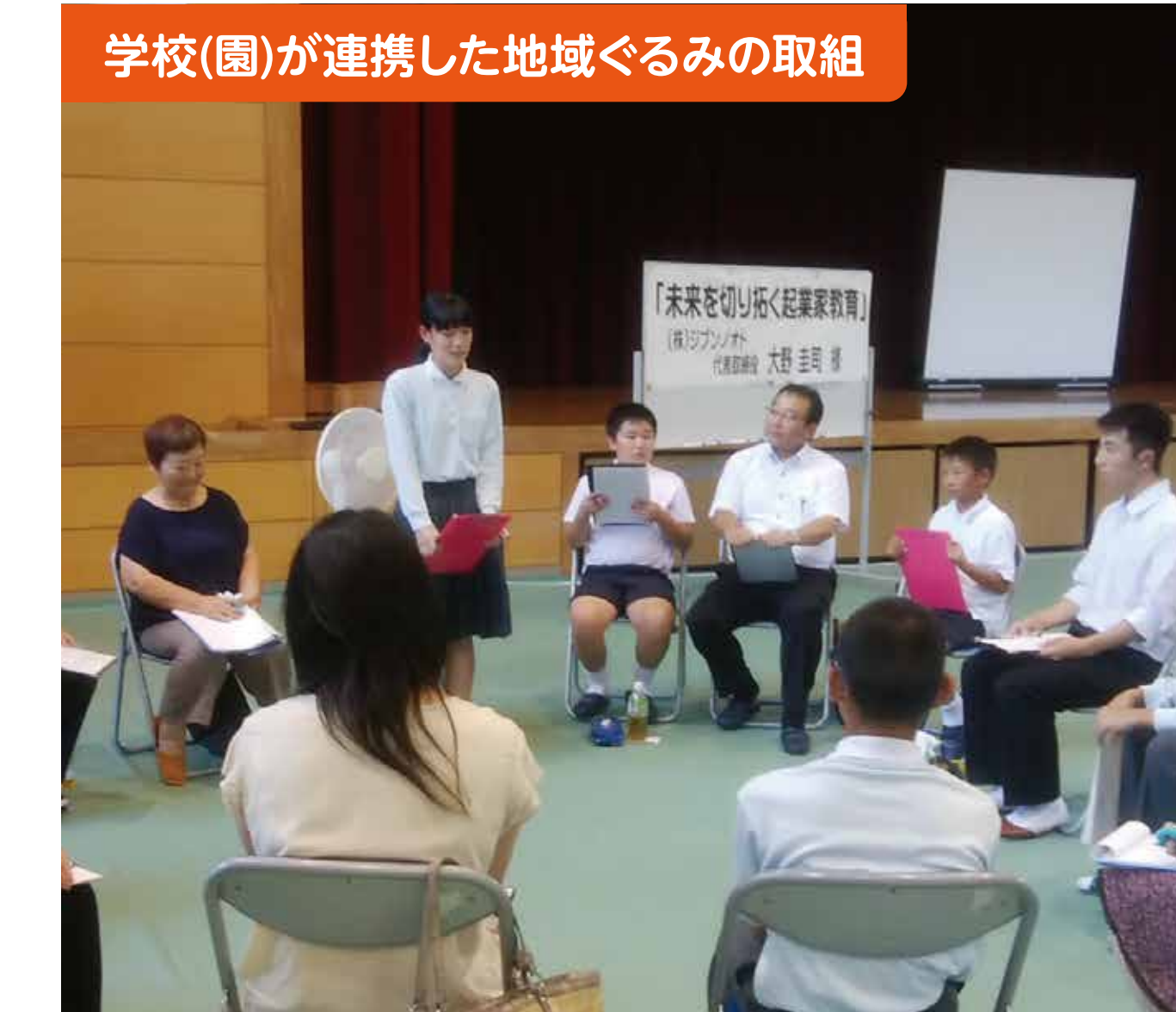
学校(園)が連携した地域ぐるみの取組

岩国市灘地区の小中高生、地域住民、米軍基地の関係者等総勢約600人が、地元の海岸で一斉清掃を実施し、交流を深めながら漂着したごみなどを毎年拾い集めています。