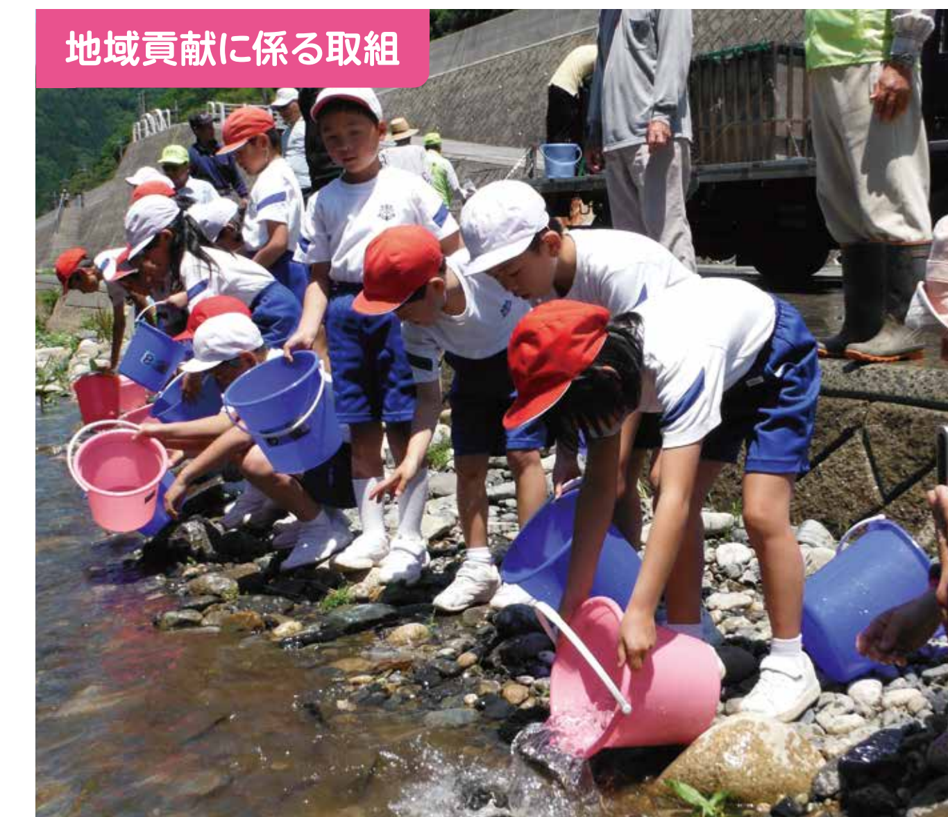
地域貢献に係る取組

地域の方々の指導により紙すきを体験し、自分の卒業証書を作っています。原料となる木の植樹から紙すきまでを行っているのは、全国的にも珍しいと言われています。