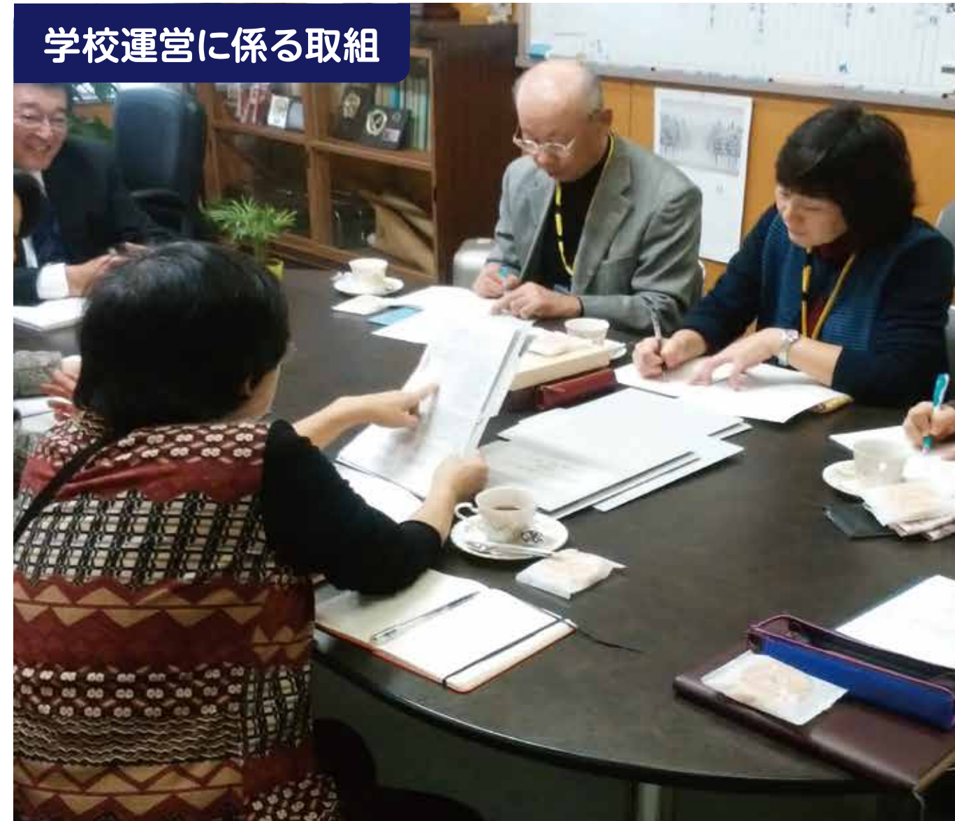
学校運営に係る取組