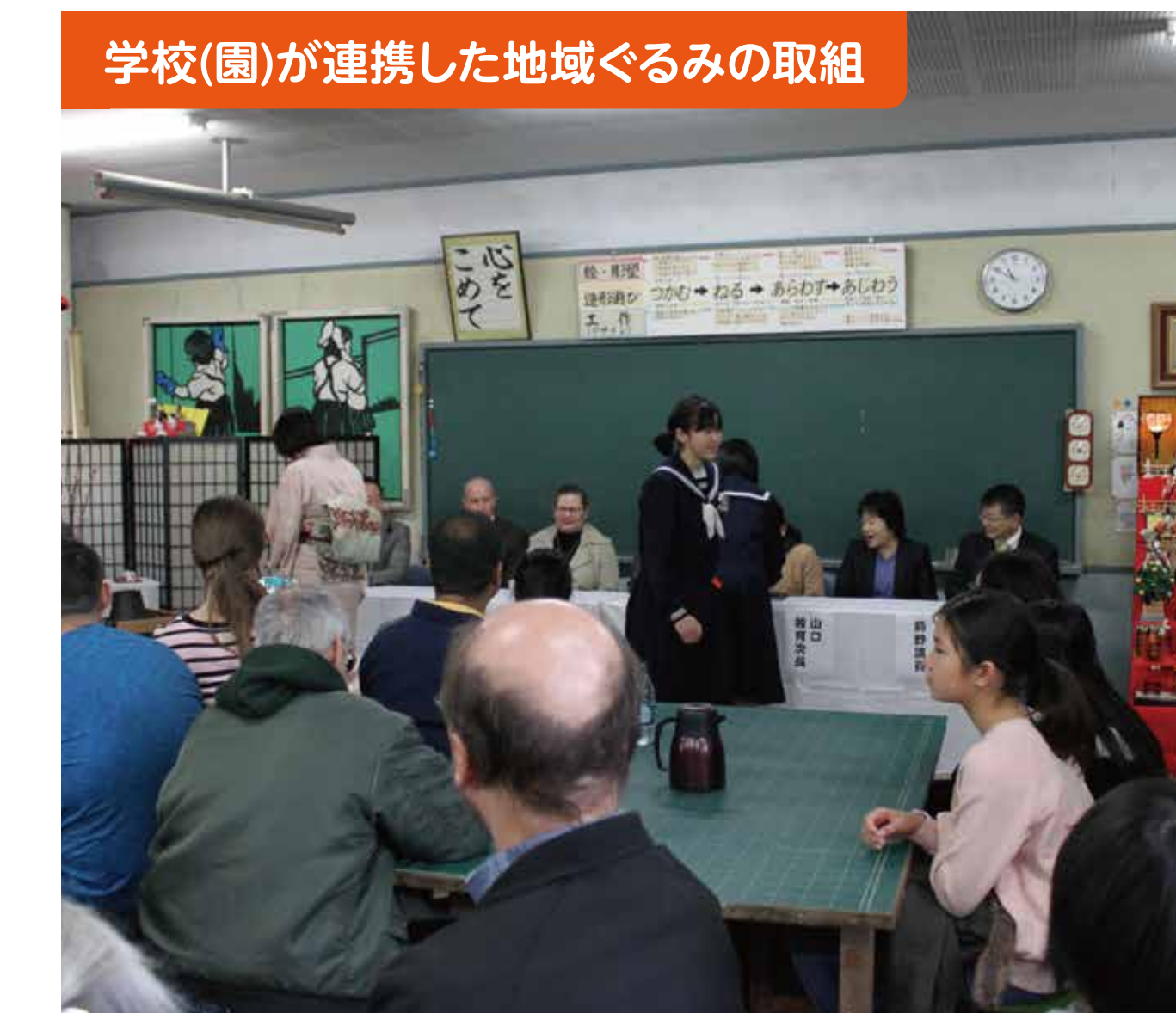
学校(園)が連携した地域ぐるみの取組

毎年5月に、錦川漁協の方々のお世話により鮎の放流を行っています。子どもたちも、ふるさとの川「錦川」の環境を守ることの大切さを感じて取り組んでいます。