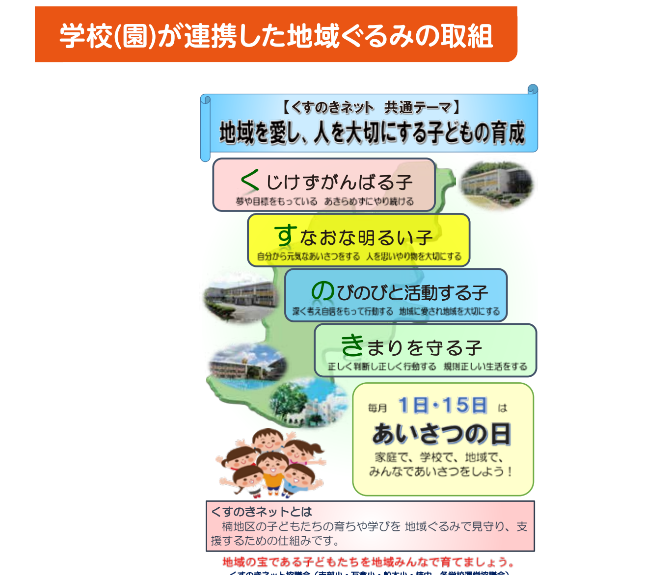
学校(園)が連携した地域ぐるみの取組

地域の運動会、夏祭り、文化祭などにボランティアとして参加。地域の方と一緒に活動することで、生徒は地域の一員としての自覚がもたえてきた。