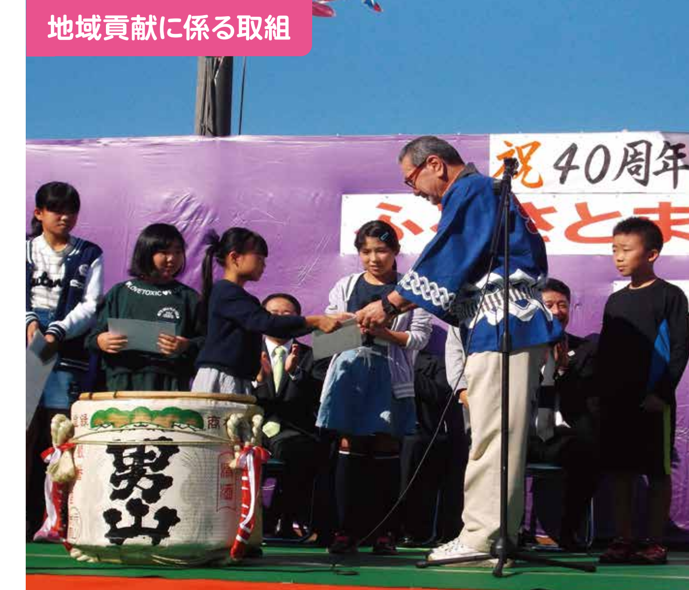
地域貢献に係る取組

生活科、総合的な学習の時間、クラブ活動などで、地域の方々から専門的な内容を教えていただいている。写真は3人の講師を招いての茶道クラブの活動の様子である。