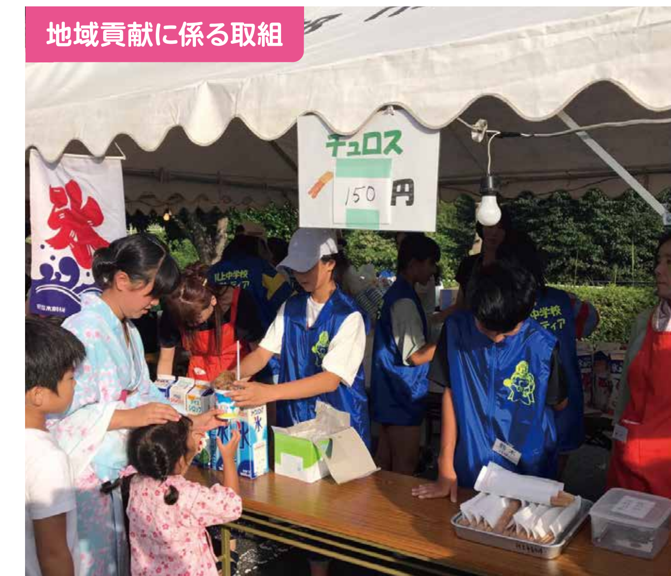
地域貢献に係る取組

保護者が年4回、自主学習ノートの点検を行い、激励コメントやシール貼付等により、生徒の学習意欲を喚起しながら家庭学習習慣定着を図っている。