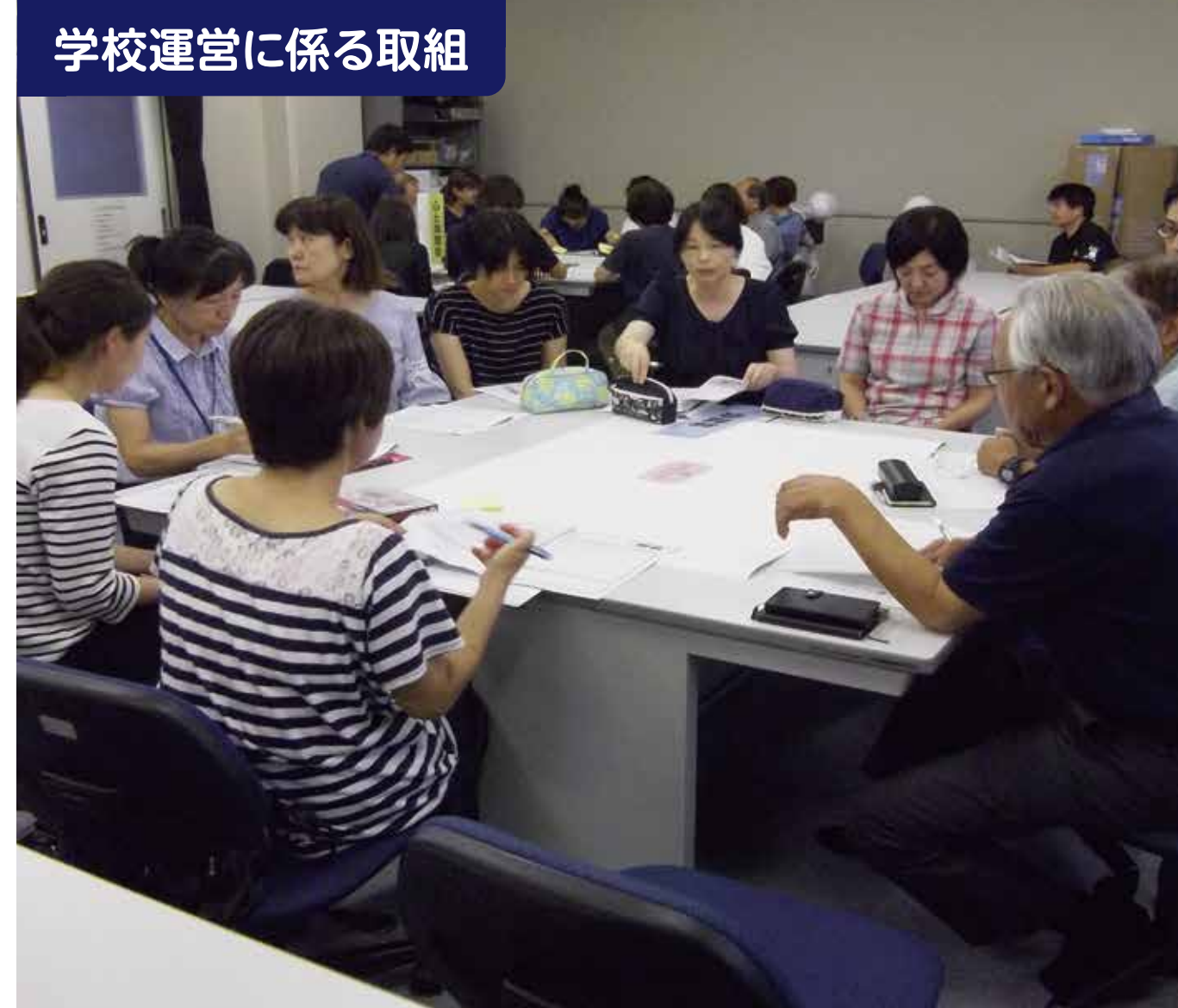
学校運営に係る取組