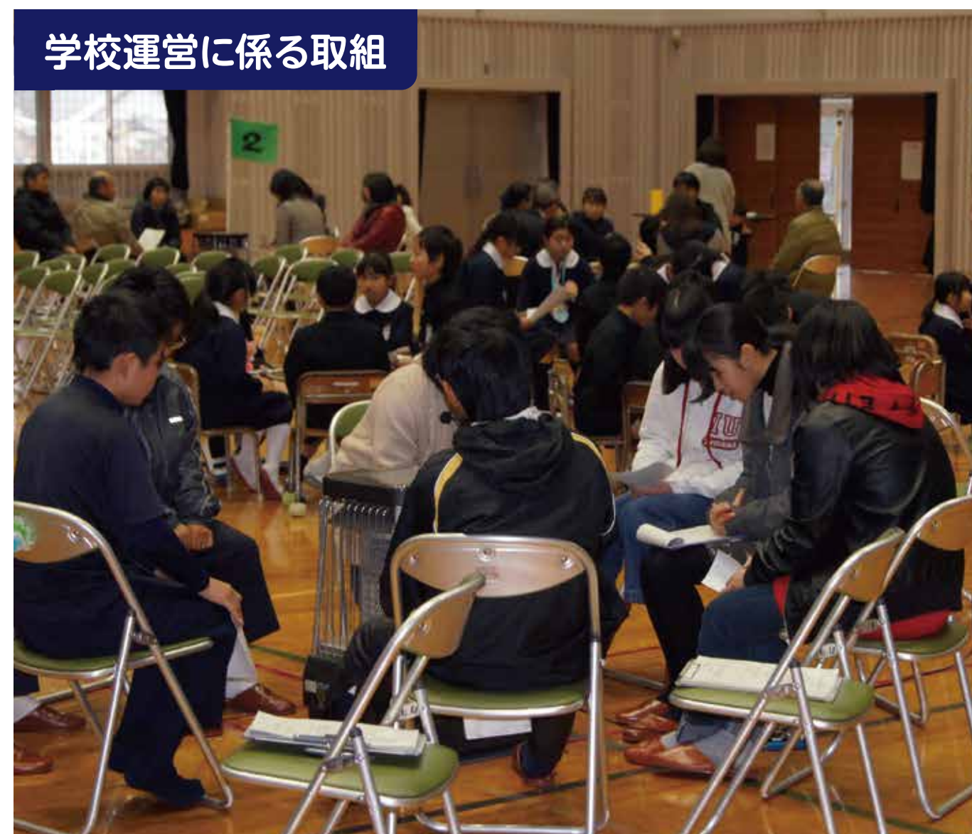
学校運営に係る取組

地域の農事組合法人との協働で希望生徒による農業体験を実施。JAや農林事務所からもサポートを得て、キャベツ栽培・販売等に関わることで地域活性化等の一翼を担う。