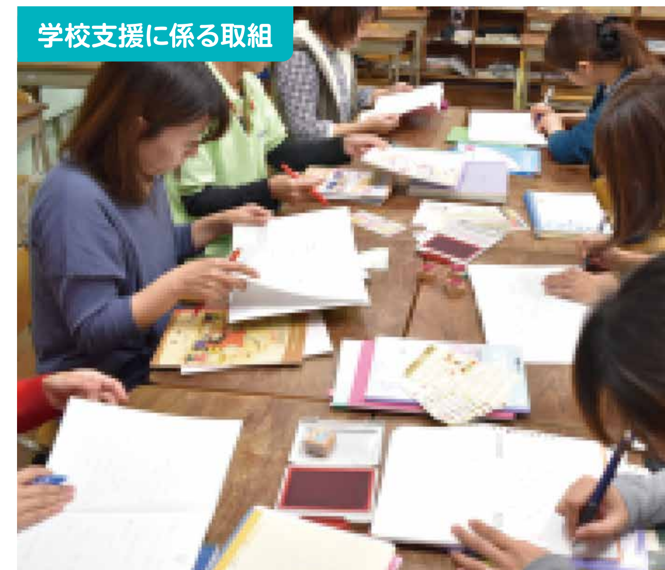
学校支援に係る取組

児童・中学生・学校運営協議会委員・地域住民・保護者・教職員が、ふるさと吉部や学校のためにできることについて「吉部っ子夢会議」で熟議を行った。