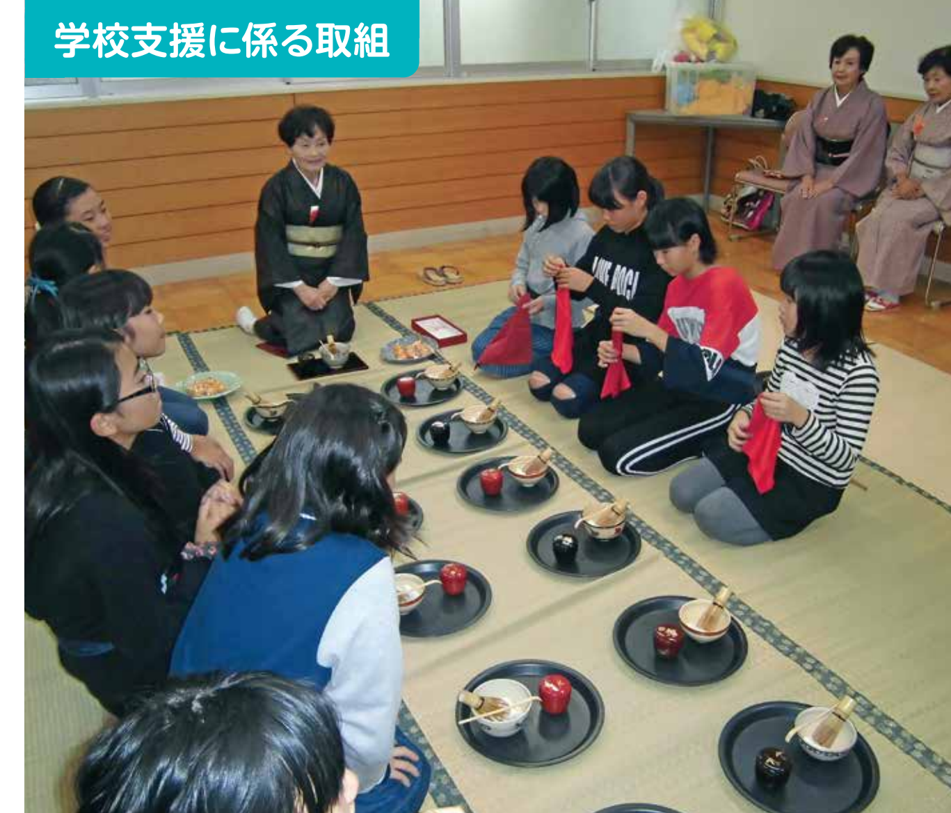
学校支援に係る取組

保護者、地域の方、教職員で、「人と関わり、愛される琴芝っ子の育成」をめざし、コミュニティ・スクール推進部会を開催。絆・心と体・学びの3つの部会に分かれ、熟議を行った。