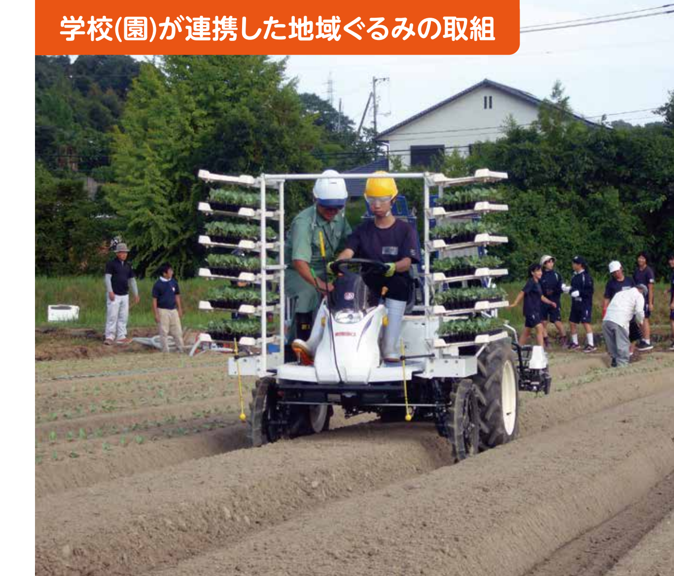
学校(園)が連携した地域ぐるみの取組

ふるさと「藤山」のいいところを標語で募集し、地域の皆さんに紹介。その中から「ふじやまっ子標語大賞」が決定し、ふるさと祭りで表彰された。