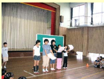
きらら委員会による行動宣言