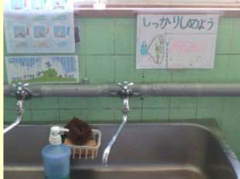
節水よびかけポスター