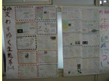
環境問題に関する新聞作成