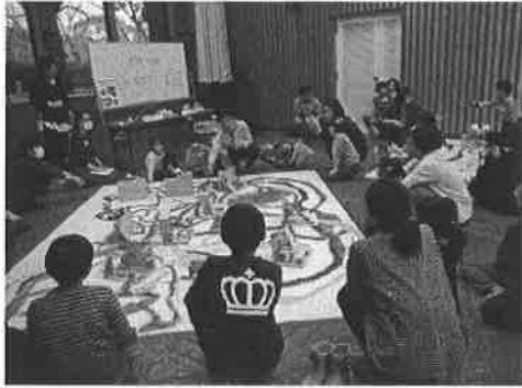
～ 美術館魅力発信プロジェクト ～