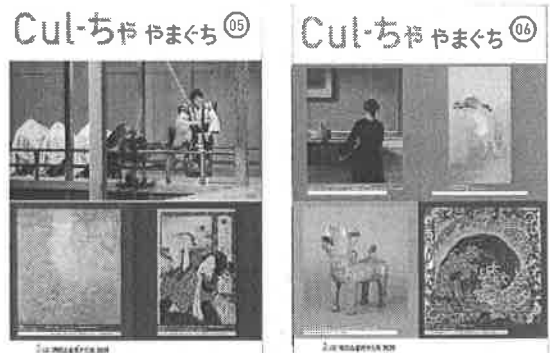
情報発信「Culーちゃ やまぐち」