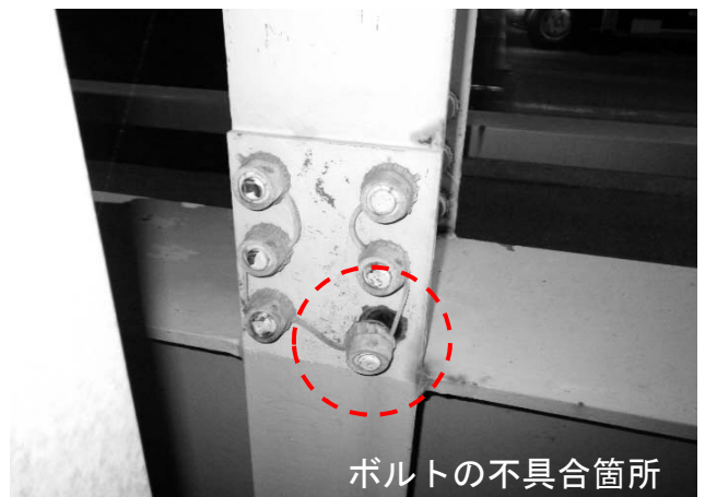
ボルトの不具合箇所